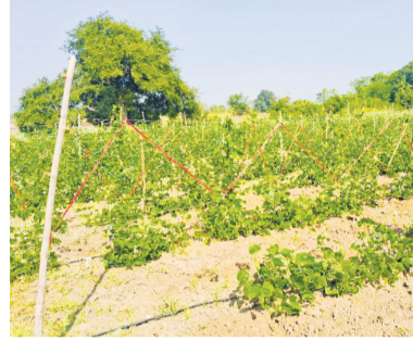
క్రమంలోనే కూరగాయల అవసరాలు బాగా పెరిగాయి. ఇందుకుగాను నాణ్యమైన మంచి ఆకారంలో ఉన్న కూరగాయలు పండించిన రైతుకు మంచి లాభాలు అంది రావడంతో ఆ

సాగు విధానాలపై చిన్న సన్నకారు రైతు సైతం ఆసక్తి చూపడం గమనార్హం. గతంలో పదిరువై ఎకరాల పెద్ద రైతులకే అందుబాటులో ఉన్న పిల్లసాని, గ్రీన్ హౌస్, పందిరి, మల్చింగ్, పల్లిగిషన్, స్ప్రికింగ్, డ్రీప్, స్పిన్నర్ లాంటి పద్ధతులు ఇప్పుడు అర ఎకరమున్న రైతుకు కూడా అందుబాటులోకి వచ్చింది. తనకున్న తక్కువ విస్తీర్ణంలో ఈ పద్ధతుల ద్వారా మంచి నాణ్యమైన పంటలను పండిస్తున్నారు.