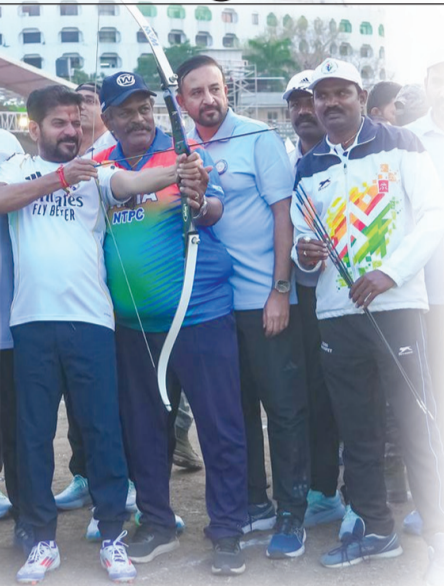
విమర్శనాస్థాలు సంధించారు.కోల్ కత్తా వంటి నగరాల్లో మెస్సీ పర్యటన గురించే కాకుండా ముగిసినా, హైదరాబాద్ లో మాత్రం అత్యంత క్రమశిక్షణతో, విజయవంతంగా నిర్వహించామని ఈ సందర్భంగా సీఎం గుర్తు చేశారు. ఇది తెలంగాణ ఆతిథ్యానికి, సమర్థతకు నిదర్శనమని రేవంత్ రెడ్డి పేర్కొన్నారు.

హైదరాబాద్, మార్చి 28 (మనం న్యూస్): ఒక్కప్పుడు తెలంగాణ క్రీడల్లో దేశంలోనే మొదటి స్థానంలో ఉండేదని, ప్రత్యేక రాష్ట్రంగా ఏర్పడిన తర్వాత రాష్ట్రంలో క్రీడా స్ఫూర్తి తగ్గిందని రాష్ట్ర ముఖ్యమంత్రి రేవంత్ రెడ్డి ఉద్ఘాటించారు. శనివారం హైదరాబాద్ ఎలీవీ స్టేడియంలో తెలంగాణ శాసన సభ్యుల సోన్ షో-2026 తొలి ఎడిషన్ ప్రారంభ కార్యక్రమంలో ముఖ్యమంత్రి రేవంత్ రెడ్డి పాల్గొని కాసేపు శాసన సభ్యులతో క్రీడల్లో పాల్గొన్నారు. ఈ సందర్భంగా ముఖ్యమంత్రి మాట్లాడుతూ నిత్యం ప్రజా క్రీడల్లో ఉన్న రాజకీయ నాయకులకు క్రీడలు ఉపశమనంగా ఉపయోగపడతాయని రేవంత్ అభిప్రాయపడ్డారు. రాష్ట్ర కేబినెట్ లో అదృతమైన క్రీడాకారులు ఉన్నారని, వారిలో ఉన్న ప్రతిభను ప్రదర్శించే అవకాశం మరోసారి సోన్ షో మీట్ ద్వారా వచ్చిందని ఆయన వెల్లడించారు. ప్రజా ప్రతినిధులంత ఇవాళ మంచి క్రీడా స్ఫూర్తిని ప్రదర్శిస్తారని ఆశాభావం వ్యక్తం చేశారు. లోగడ తెలంగాణ క్రీడల రాజధానిగా ఉండేదని, ఆ తర్వాత రాష్ట్రంలో సుదీర్ఘ కాలంగా క్రీడాపోటీలు నిర్వహించక పోవడంతో తెలంగాణ వచ్చాక క్రీడా స్ఫూర్తి తగ్గిందని అని సీఎం రేవంత్ రెడ్డి కీలక వ్యాఖ్యలు చేశారు.