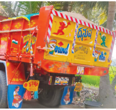
లేదా అని ప్రభుత్వాన్ని ప్రశ్నిస్తున్నారు ఇసుక ఎక్కడ ప్రభుత్వం పాటాలో దళారులతో సరఫరా చేసిన సరసమైన ధర తీసుకోవాలని ప్రస్తుత ప్రభుత్వం పెద్దలకు వినియోగదారులు విజ్ఞప్తి చేశారు

ఆవంట్ల ఫిబ్రవరి 28 మనం న్యూస్: వశిష్ట గోదావరి నుండి ప్రకృతి ప్రసాదించిన ఇసుకను గ్రామీణ ప్రజలకు ప్రభుత్వం విక్రయం చేయడం లేదా దళారులతో విక్రయం జరుగుతుందా అని గ్రామీణ ప్రజలు ప్రస్తుత ప్రభుత్వాన్ని ప్రశ్నిస్తున్నారు. ఇసుక కొనుగోలుదారులు మాట్లాడుతూ గృహ నిర్మాణం కోసం గత్యంతరం లేక ప్రభుత్వం ఉచితంగా ఇచ్చే ఇసుక అధిక ధరలకు కొనుగోలు చేయాలి వస్తుందని ఆవేదన వ్యక్తం చేశారు ప్రభుత్వం ఆదేశాల మేరకు ఇసుక వినియోగదారులకు సరఫరా చేస్తున్నారా