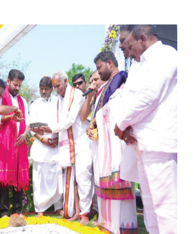
రామప్ప శివుడి సాక్షిగా మూసీ ప్రక్షాళన చేసి ఈ ప్రాంతాన్ని దక్షిణ కాశీగా మారుస్తామని ఈ సందర్భంగా సీఎం రేవంత్ రెడ్డి స్పష్టం చేశారు.

ఈ సందర్భంగా మంత్రి తుమ్మల నాగేశ్వరరావు మాట్లాడుతూ రాష్ట్ర ప్రజలు సుభిక్షంగా ఉండాలని, రైతులు ఆర్థికంగా అభివృద్ధి సాధించాలని భగవంతుని ప్రార్థిస్తున్నట్లు తెలిపారు. భద్రాచలం అలయ అభివృద్ధి రామభక్తుల చిరకాల వాంఛ అని పేర్కొన్నారు. రాష్ట్ర ముఖ్యమంత్రి ఎనుముల రేవంత్ రెడ్డి చేతుల మీదుగా సుమారు రూ.350 కోట్ల వ్యయంతో అలయ అభివృద్ధి పనులకు భూమిపూజ నిర్వహించినట్లు తెలిపారు. భద్రాచలాన్ని అన్ని విధాలుగా అభివృద్ధి పడంలో ముందుకు తీసుకువెళ్లేందుకు ప్రభుత్వం కట్టుబడి ఉన్నదని స్పష్టం చేశారు. అనంతరం ఐటీడీపీ ఆధ్వర్యంలో