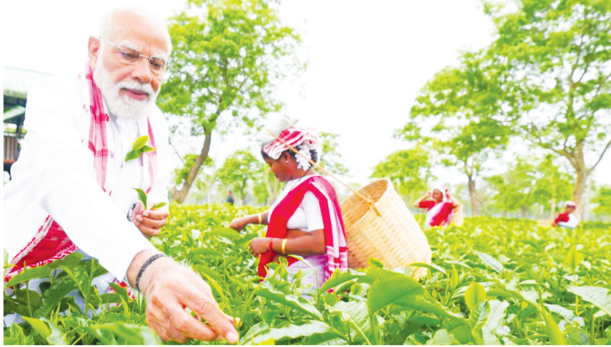
● ప్రధాని సరేంద్ర మోడీ

డిహ్రాద్, ఏప్రిల్ 1: అస్సాంలో బీజేపీ మూడోసారి హోలీకొట్టడం ఖాయమని ప్రధాని సరేంద్ర మోడీ అన్నారు. ఈ సందర్భంగా కాంగ్రెస్ పార్టీ అగ్రనేత రాహుల్ గాంధీని ఉద్దేశించి... 'అ పార్టీ యువరాజుకు వందోసారి కూడా ఓటమి తప్పదు' అని ఎద్దేవా చేశారు. అసెంబ్లీ ఎన్నికల సందర్భంలో మోడీ అస్సాంలో పర్యటించారు. ఈ సందర్భంగా గోముఖ్ జరిగిన బహిరంగ సభలో మాట్లాడారు.