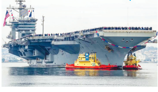
వాషింగ్టన్, ఏప్రిల్ 1: రబోయే రోజుల్లో ఇరాన్ పై దాడులు మరింత భీకరంగా ఉంటాయని అమెరికా హెచ్చరించిన వేళ కీలక పరిణామం చోటుచేసుకుంది. అగ్ర రాజ్యానికి చెందిన మరో విమాన వాహక నౌక పశ్చిమాసియాలో

మోహరించనుంది. యూఎస్ఎస్ హెచ్ఎస్ఎస్ బుడ్ నౌక పశ్చిమాసియా దిశగా బయల్దేరింది అమెరికా రక్షణ మంత్రి పీట్ హెగ్నెట్ వెల్లడించారు. పశ్చిమాసియాలోని నార్ ఫోర్స్ నుంచి ఈ విమాన వాహక నౌక బయల్దేరింది. ఇప్పటికే పశ్చిమాసియాలో యూఎస్ఎస్ జెరల్ ఆర్ ఫోర్స్, యూఎస్ఎస్ తెలెస్టోన్ లింకన్ అనే రెండు విమాన వాహక నౌకలు మోహరించిన సంగతి తెలిసింది. వాటికి అదనంగా యూఎస్ఎస్ హెచ్ఎస్ఎస్ బుడ్ రంగంలోకి దిగుతుంది. యూఎస్ఎస్ జెరల్ ఆర్ ఫోర్స్లో సమస్యలు ఎదురైనట్లు ఇటీవల వార్తలు వచ్చినవేళ.. ఈ పరిణామం చోటుచేసుకోవడం గమనార్హం. ఇరాన్లో దాదాపు నెల రోజులకు పైగా సాగిన యుద్ధంలో అత్యంత కీలకమైన రోజులు త్వరలో ప్రారంభం కానున్నాయని అమెరికా అధ్యక్షుడు ట్రంప్ దేశంలో హెచ్చరించారు. ఈ సందర్భంలో వెలాది మంది అమెరికా సైనికులు పశ్చిమాసియా వైపు వెళ్తున్నారని అంతర్జాతీయ మీడియా కథనాలు రాసుకోవచ్చాయి. ఇరాన్లో భూతల దాడుల కోసమే వీరిని పంపుతున్నట్లు అంచనాలు వెలువడుతున్నాయి.