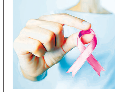
● డి.బి.వి.ఎల్ 1: రొమ్ము కణజాలానికి సంబంధించిన సవినయ మ్యూసీను శాస్త్రవేత్తలు అభివృద్ధి చేశారు. మహిళలకు వయసు మీదపడే

సవినయ మ్యూసీను రూపొందించిన శాస్త్రవేత్తలు కొద్ది కణజాల క్షీణనలతోపాటు వాటి వృద్ధి తక్కువగా ఉంటున్నట్లు ఇవి సృష్టించేస్తున్నట్లు వివరించారు. తద్వారా ఒక సూక్ష్మ వాతావరణం ఏర్పడుతుందని, అందులో క్యాన్సర్ కణాలు వృద్ధి అనుకూల పరిస్థితులు ఉంటాయని తెలిపారు. కేంద్రీకృత విశ్వవిద్యాలయ శాస్త్రవేత్తలు ఈ పరిశోధన చేశారు. ప్రపంచవ్యాప్తంగా ఏడాది 20 లక్షల సంబంధించిన సవినయ మ్యూసీను శాస్త్రవేత్తలు బారినపడుతున్నా.. ఆ సమస్య ఎప్పుడు, మహిళలను వీడిస్తున్న క్యాన్సర్లో రొమ్ము క్యాన్సర్ వాటా ఎక్కువ. 80 శాతం కేసులు.. 50 ఏళ్లు పైబడ్డ అతివృద్ధులలో చోటుచేసుకుంటున్నాయి. వయసు మీదపడేకొద్దీ ఈ క్యాన్సర్ బారినపడే ముప్పు పెరుగుతూనే ఉంటుంది. ఇమెజింగ్ విధానాల సాయంతో.. 15 నుంచి 86 ఏళ్ల మధ్య ఉన్న 500 మంది మహిళల రొమ్ము కణజాలాన్ని శాస్త్రవేత్తలు విశ్లేషించారు. ఈ విశ్లేషణల ఫలితంగా గ్రాహకాలు, రోగనిరోధక కణాలు, కణజాల తీరుతులతో కలిపి ఒక మ్యూపు వారు తయారవుతారు. కాలక్రమంలో రొమ్ము కణజాలం ఎలా మారుతుందన్నది కళ్లకు అందకుండా ఉంది" అని పేర్కొన్నారు.