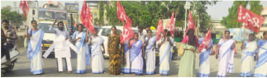
జాతీయ రహదారిపై రాస్ట్రోకో కోసం దివ్యబొమ్మ దహనం

మేడ్చల్, మార్చి 31 ( మనం జిల్లా ప్రతినిధి ) : మేడ్చల్ జాతీయ రహదారి పైన సీబీయూ ఆధ్వర్యంలో రాస్ట్రోకో చేసి తెలంగాణ ముఖ్యమంత్రి రేవంత్ రెడ్డి దివ్య బొమ్మను దగ్ధం ను దహనం చేశారు.