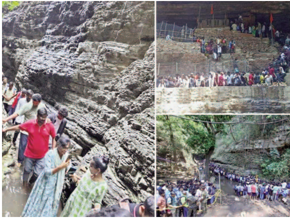
నల్లమల్ల సలేశ్వరం లింగమయ్య ఆలయ చరిత్ర..

నాగార్జున కొండలో బయటపడిన ఆధారాలను బట్టి ఇక్కడ కాలం క్రీస్తు శకం 360 కాలపు నిర్మాణాలు లింగమయ్య గుడికి ఏర్పాటుచేసిన ఇటుకలను బట్టి అర్థమవుతుంది. అలాగే గర్భగుడి ముఖద్వారం నాటి విష్ణు కుండీల శిలాఫలకం ఉన్నది. అలయాన్ని ద్వారానికి కుడివైపున వీరభద్రుడు దక్షకుడి విగ్రహాలు, ఎడమవైపున రెండు సిద్ధి విగ్రహాలు ఉన్నాయి. అలయానికి ముందు భాగంలో 10 అడుగుల క్రింద సలేశ్వరం గుండం వుంది.