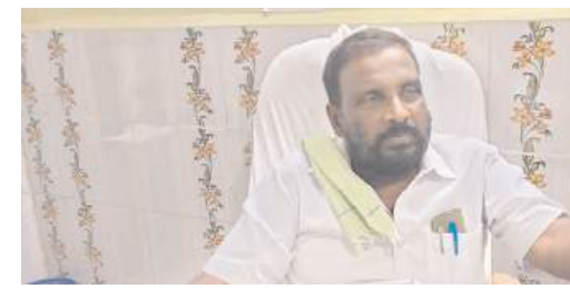
వివరాలు తెలియజేయాలని ఆదేశించారు. గ్రామస్థులందరూ గ్రామసభలకు హాజరై తమ సమస్యలను వెల్లడించాలని ఎంపీడీవో కోరారు.

మణుగూరు(పినపాక), మార్చి 31(మనం న్యూస్): ప్రజా పాలన ప్రగతి ప్రణాళిక కార్యక్రమంలో భాగంగా ఏప్రిల్ 2న తేదీన అన్ని గ్రామ పంచాయతీల్లో గ్రామసభలు నిర్వహించాలని పినపాక ఎంపీడీవో వెంకటేశ్వరరావు తెలిపారు. మంగళవారం పినపాక ఎంపీడీవో కార్యాలయంలో సైక్లరీలతో టెలి కాన్ఫరెన్స్ నిర్వహించిన ఆయన, గ్రామసభల నిర్వహణపై పలు కీలక ఆదేశాలు జారీ చేశారు. గ్రామసభలను సమయానికి నిర్వహిస్తూ ప్రజల సమస్యలను నమోదు చేసి, వెంటనే పరిష్కారానికి చర్యలు తీసుకోవాలని సూచించారు.అలాగే ప్రభుత్వ పథకాల అమలు, గ్రామాభివృద్ధి పనులపై సమగ్ర చర్చ జరిపి, ప్రజలకు పూర్తి