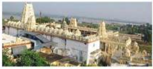
అమం కోసం ఆర్థిక యాత్ర.