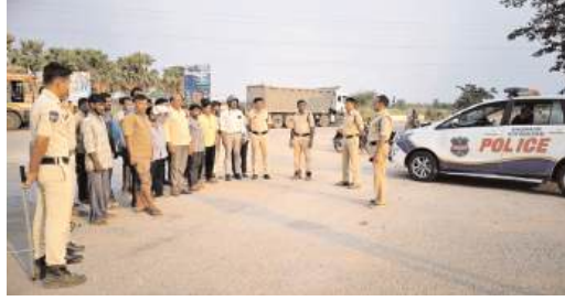
చేశారు.వాహన తనిఖీల సమయంలో యువతతో నేరుగా మాట్లాడిన పోలీసులు, వారి సందేహాలను నివృత్తి చేస్తూ అవగాహన కల్పించారు. సమాజంలో మంచి మార్పు రావాలంటే యువతే ముందుకు రావాలని, చెడు అలవాట్లకు దూరంగా ఉండాలని పిలుపునిచ్చారు.

అశ్వాపురం, మార్చి 31 ( మనం న్యూస్ ): మండల పరిధిలోని గొల్లగూడెం ప్రాంతంలో మంగళవారం నిర్వహించిన వాహన తనిఖీల్లో భాగంగా అశ్వాపురం పోలీసులు యువతకు విస్తృత అవగాహన కల్పించారు. ఈ సందర్భంగా పోలీసులు రోడ్డు భద్రతతో పాటు మత్తు పదార్థాల ప్రమాదాలపై యువతను చైతన్యపరిచారు. యువత మేలుకో- భవిష్యత్తు నిర్మించుకో అనే నినాదంతో చేపట్టిన ఈ కార్యక్రమంలో గంజాయి వంటి మత్తు పదార్థాల వల్ల కలిగే అనర్థాలను వివరించారు. గంజాయి మత్తుకు అలవాటు పడితే ఆరోగ్యం, కుటుంబం, భవిష్యత్తు అన్నీ దెబ్బతింటాయని హెచ్చరించారు. యువత మంచి మార్గంలో నడిచి తమ లక్ష్యాలను సాధించాలని సూచించారు. రోడ్డు భద్రతపై కూడా ప్రత్యేక దృష్టి పెట్టిన పోలీసులు, ద్విచక్ర వాహనదారులు తప్పనిసరిగా హెల్మెట్ ధరించాలని సూచించారు. హెల్మెట్ వాడకం ప్రాణాలను కాపాడే ముఖ్యమైన రక్షణ చర్య అని తెలియజేశారు. ట్రాఫిక్ నిబంధనలు పాటించడం ప్రతి ఒక్కరి బాధ్యత అని స్పష్టం