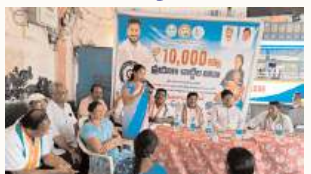
మణుగూరు, మార్చి 31(మనం న్యూస్): మణుగూరు సురక్ష బస్టాండ్ ఆవరణలో రాష్ట్ర మహిళలందరికీ శుభాకాంక్షలు తెలుపుతూ మహాలక్ష్మి పథకం ద్వారా 10000 కోట్లు ఆదా చేసుకున్నందుకు సమావేశం ఏర్పాటు చేశారు.