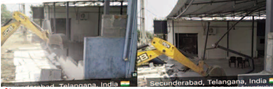
డిసీ వసంత ఆదేశాలతో టౌన్ ప్లానింగ్ విభాగం కఠిన చర్యలు.

కీసర సర్కిల్, ఏప్రిల్ 15 (మనం న్యూస్): కీసర సర్కిల్ పరిధిలో అక్రమంగా నిర్మించిన షెడ్లపై అధికారులు ఉక్కుపాదం మోచారు. కీసర పోలీస్ స్టేషన్ ప్రధాన రహదారి ప్రక్కన, అంబేద్కర్ నగర్ రోడ్డు పెట్రోల్ పంపుకు సమీపంలో ఎలాంటి అనుమతులు లేకుండా నిర్మించిన రేకుల షెడ్లను టౌన్ ప్లానింగ్ అధికారులు కూల్చివేశారు.