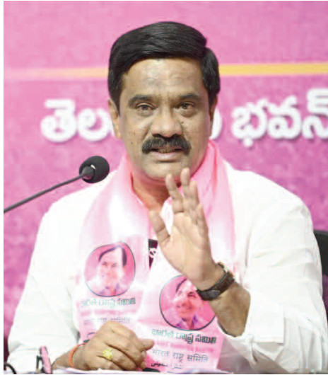
తెలంగాణ రాష్ట్ర ఏర్పాటుపై అవమానకరంగా మాట్లాడుతుంటే అదే పార్లమెంట్ సమావేశాల్లో ఉన్న తెలంగాణకు చెందిన 8 బీజేపీ, 8 కాంగ్రెస్ ఎంపీలు మానం వహించడం సిగ్గుచేటు. తెలంగాణలో గెలిచిన ప్రజాప్రతినిధులు ఢిల్లీలో రాష్ట్ర గౌరవాన్ని కాపాడాల్సిన బాధ్యత వారిపై ఉందని గుర్తుచేశారు. తేజస్వి సూర్య వ్యాఖ్యలను

ఎంపీపై వెంటనే చర్యలు తీసుకుని పార్లమెంట్ నుండి సస్పెండ్ చేయాలని కేంద్ర ప్రభుత్వాన్ని డిమాండ్ చేశారు. అంతేకాకుండా, తన వ్యాఖ్యలను వెంటనే వెనక్కి తీసుకుని తెలంగాణ ప్రజలకు బహిరంగంగా క్షమాపణ చెప్పాలని తేజస్వి సూర్యను కోరారు. రాజ్యాంగబద్ధంగా ఏర్పడిన తెలంగాణ దేశానికి రోల్ మోడల్గా నిలుస్తుండటాన్ని బీజేపీ తట్టుకోలేకపోతోందని, బీజేపీ ఎంపీ తేజస్వి సూర్య అహంకారపూరిత వ్యాఖ్యలే దీనికి నిదర్శనమని విమర్శించారు. తెలంగాణ ఏర్పాటును ఇండియా- పాకిస్తాన్ విభజనతో పోల్చడం అంటే పార్లమెంట్ ను, 140 కోట్ల దేశ ప్రజలను అవమాన పరచడమేనని అన్నారు. ఒకవేళ తెలంగాణ ఏర్పాటు అదే తరహాలో ఉంటే, విభజన బిల్లుకు అప్పట్లో బీజేపీ ఎందుకు మద్దతు తెలిపిందని ప్రశ్నించారు. ప్రధాని నరేంద్ర మోడీ కూడా గతంలో తెలంగాణ ఏర్పాటు ప్రక్రియపై అనుచిత వ్యాఖ్యలు చేశారని గుర్తుచేశారు. నాడు మోడీ అయినా, నేడు తేజస్వి సూర్య అయినా తెలంగాణ ప్రజల మనోభావాలను గాయపరిచారని అన్నారు. బీజేపీ ఎంపీ తేజస్వి