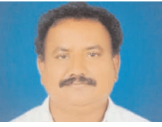
కలిసి రావాలని, వచ్చే ఎన్నికల్లో బీజేపీ విజయం తర్ఫుం అని తెలియజేశారు.

కోత్ గూడెం జిల్లాలోని బీజేపీ నాయకత్వాన్ని, కార్యకర్తలను సంయమనం చేసుకుంటూ, అందరినీ కలుపుకుంటూ, ప్రజా సమస్యల పరిష్కారం కొరకు కృషి చేస్తూ, పార్టీ అభివృద్ధికి పాటు పడతానని, జిల్లాలో అత్యధికులు దళితులు, గిరిజనులు, బలహీన వర్గాలు కనుక అర్హులైన వారందరికీ కేంద్ర ప్రభుత్వ పథకాలు అందేలా చూస్తానని, వికసిత భారత్ కొరకు ప్రజలందరూ బీజేపీ తో