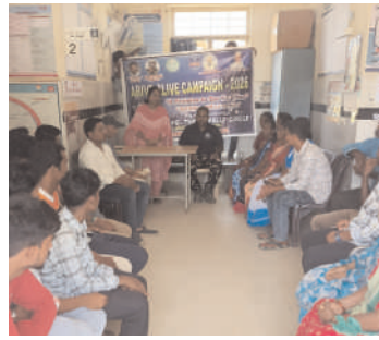
వైద్య సిబ్బంది, పోలీస్ సిబ్బంది, ప్రజలు, పాల్గొన్నారు.