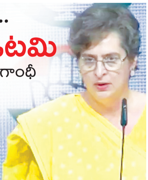
"ఇది ప్రభుత్వానికి ఎదురుదెబ్బ. ఆ కాటమి కుదుపును లోనయింది" అని వ్యాఖ్యానించారు. ఈ సందర్భంగా కేంద్రానికి సవాలు విసిరారు. "2023లో ఇప్పటికే ఆమోదం పొందిన మహిళా రిజర్వేషన్ బిల్లును తీసుకురండి. అందుకోసం సోపానం పార్లమెంట్ సమావేశాలు నిర్వహించండి. దానికి మా పూర్తి మద్దతు తప్పకుండా ఉంటుంది. అప్పుడు తెలుస్తుంది.. మహిళా వ్యతిరేకులు ఎవరో" అని ప్రియాంకా పేర్కొన్నారు.

ఢిల్లీ, ఏప్రిల్ 18 : లోక్ సభలో మహిళా రిజర్వేషన్ల కోసం తెచ్చిన రాజ్యాంగ సవరణ బిల్లు వీగిపోవడంపై కాంగ్రెస్ ఎంపీ ప్రియాంకా గాంధీ స్పందించారు. ఇది డీలిమిటేషన్, మహిళల హక్కుల కోసం తీసుకొచ్చిన బిల్లు కాదన్నారు. విపక్షాలన్నీ ఏకతాటి పైకి వచ్చి ప్రభుత్వాన్ని ఓడించాలని తెలిపారు. ఎన్డీయేకు ఇది చీకటి రోజు అని, వారు తీసుకొచ్చిన బిల్లు తొలిసారిగా లోక్ సభలో ఓడిపోయిందని విమర్శించారు. లోక్ సభలో ప్రవేశపెట్టిన బిల్లుల విషయంలో ఫలితంతో సంబంధం లేకుండా తమకే ఘనత దక్కాలా అధికారపక్షం ఎత్తుగడ వేసినదని దుయ్యబట్టారు. "బిల్లు ఆమోదం పొందినా.. పొందకపోయినా అది తమకు విజయమేనని వారు విశ్వసించారు. మహిళల హక్కుల కోసం పోరాడేది కామెన్స్ ను నిర్మించాలనుకున్నారు. కానీ అది అంత సులభం కాదు" అని ప్రియాంకా అన్నారు. డీలిమిటేషన్, మహిళా రిజర్వేషన్ బిల్లుతో ముడిపెట్టడాన్ని ఆమె ప్రశ్నించారు. పార్లమెంట్, రాష్ట్ర శాసనసభల్లో మహిళలకు రిజర్వేషన్ల కల్పించడం పేరిట వ్యవస్థలపై ఏమాత్రం గౌరవం లేకుండా అధికారపక్షం ప్రతిపక్షాలు అడ్డుకున్నాయన్నారు.