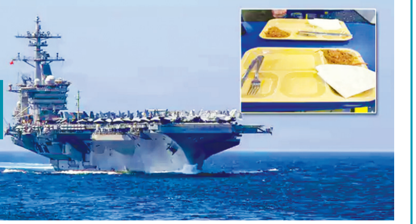
యూఎస్ఎస్ అబ్రహం లింకన్లోనూ నాణ్యమైన ఆహారం లభించడం లేదని వెల్లడించాయి. నాణ్యత పక్కనపెడితే.. అందులోని వారు ఎప్పుడూ ఆకలితోనే ఉంటున్నారట. ఇదిలా ఉంటే.. ఇరాన్ వారల్లో భాగమైన విమాన వాహక నౌక జెరల్ ఆర్ ఫోర్ట్ లోని ప్రధాన లాండ్ రీ విభాగంలో అగ్ని ప్రమాదం జరిగిన సంగతి తెలిసింది. దీంతో పలు కంపార్ట్మెంట్లలోని అమెరికా సైనికులు, నావికులు వివిధ వాయువులు పీల్చి అన్యస్తృతకు గురయ్యారు. ఆ నౌకలో విధులు నిర్వహిస్తున్న 4,500 మంది సిబ్బంది టాయిలెట్ కష్టాలను ఎదుర్కొన్నట్లు కథనాలు వెలువడ్డాయి. యుద్ధనౌక నిరంతరం కడులుతున్నందున, సరైన నిర్వహణ లేకపోవడంతో అందులో ఉన్న మరుగుదొడ్లు పనిచేయకపోవడంతో వారు తీవ్రంగా

కుటుంబాలు విధుల్లో తమ వారికి ఆహారం, ఇతర ఉత్పత్తులు సందించేందుకు వీలు లేకుండా పోయింది. ఇక, యూఎస్ఎస్ ట్రిబిలిటీలో ఉన్న ఆహారాన్ని రేషన్ పద్ధతిలో వారుకొచ్చాలి వస్తోందని తెలుస్తోంది. తాజా సరకులు అనేవే చేయడంతో ఈ విషయం వెలుగులోకి వచ్చింది. స్థానిక మీడియా కథనాలు వెల్లడించాయి. అలాగే మిలిటరీ జివ్ కోడ్స్ (విడికాల్లోని సైనిక, దౌత్య కార్యాలయాలకు సంపే పోస్టులు)కు పోస్టల్ సేవలను నిలిపివేయడంతో పరిస్థితి మరింత తీవ్రపరచు దాల్చింది. దీంతో యూఎస్ఎస్