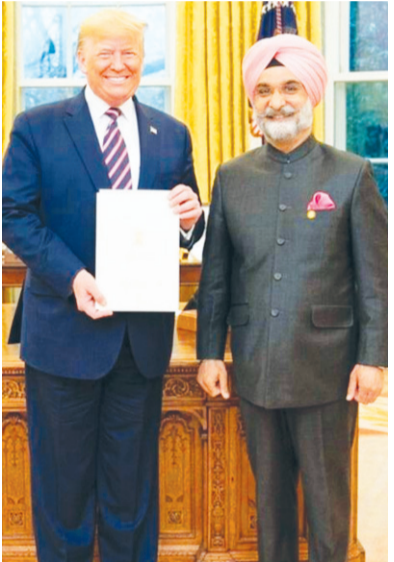
వాషింగ్టన్, ఏప్రిల్ 18 : ఢిల్లీ లెజ్సింట్ గవర్నర్ తరణ్జిత్ సింగ్ సంధూపై అమెరికా అధ్యక్షుడు డొనాల్డ్ ట్రంప్ ప్రశంసలు కురిపించారు. ఈ మేరకు అయిన సామాజిక మాధ్యమం ట్విట్ వేదికగా పోస్టు చేశారు. 'ఢిల్లీ కొత్త లెజ్సింట్ గవర్నర్ గా నియమితులైన తరణ్జిత్ సింగ్ సంధూకి అభినందనలు. అమెరికా మాజీ రాయబారిగా ఇరు దేశాల మధ్య ద్వైపాక్షిక సంబంధాలు మరింత బలపడేందుకు తరణ్జిత్ ఎంతో నిబద్ధత కనబరిచారు' అని రాసుకొచ్చారు. సంధు నేతృత్వంలో ఢిల్లీ మరింత అభివృద్ధి సాధించాలని ట్రంప్ ఆశాంక్షించారు. ఈ సందర్భంగా అయినట్ దిగిన ఫోటోను కూడా పంచుకున్నారు. ఢిల్లీ లెజ్సింట్ గవర్నర్ తరణ్జిత్ మార్చి 11న బాధ్యతలు స్వీకరించిన విషయం విడితమే.