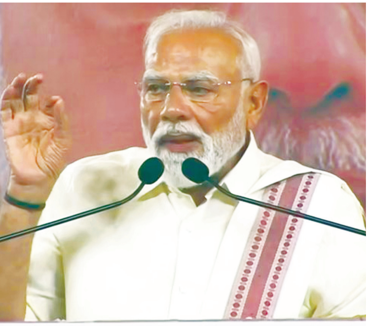
కుటుంబాల మహిళలు పార్లమెంటు, అసెంబ్లీలకు రావాలని తాను కోరుకున్నానని, మహిళా రిజర్వేషన్ల క్రమంలో ప్రతిపక్షాల తీసుకోవాలని కూడా చెప్పినట్లు గుర్తుచేశారు. సాధారణ మహిళలు ఎదగాన్ని చూసి డీఎంకే, కాంగ్రెస్లు ఎందుకు ఓర్చుకోలేకపోతున్నాయని ప్రశ్నించారు. ఈ పార్టీల అధికారం తమ కుటుంబానికి పరిమితం కావాలని కోరుకుంటున్నాయని ఆరోపించారు. మహిళా రిజర్వేషన్లపై తమ పోరాటం ముగిసిపోలేదని, ఇది ఆరంభం మాత్రమేనన్నారు. మహిళా హక్కుల కోసం బీజేపీ, ఎన్డీయేల పోరాటం కొనసాగుతుందని ప్రధాని నరేంద్ర మోడీ అన్నారు.

కోయంబత్తూర్, ఏప్రిల్ 18 : మహిళా రిజర్వేషన్ల కోసం ఎంతో కృషి చేసినప్పటికీ.. దురదృష్టవశాత్తూ ఫలితం లేకుండా పోయింది ప్రధాని నరేంద్ర మోడీ వ్యాఖ్యానించారు. డీఎంకే, కాంగ్రెస్, దాని మిత్రపక్షాలు తమ సీన రాజకీయాల కోసం దీనిని లక్ష్యంగా చేసుకుని అడ్డుకున్నాయని ఆరోపించారు. అసెంబ్లీ ఎన్నికల నేపథ్యంలో తమిళనాడులోని కోయంబత్తూరులో నిర్వహించిన ఎన్నికల అవినీతి ప్రధాని మోడీ ఈ మేరకు ప్రసంగించారు. 2011 జనాభా లెక్కల ప్రకారం డీలిమిటేషన్ ద్వారా తమిళనాడుకు మరొక్క సీట్లు రావాలి ఉండగా డీఎంకే అలా జరగాలని కోరుతున్నారని, సాధారణ