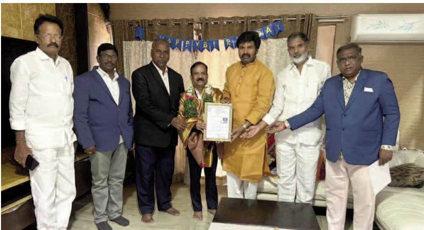
పురస్కారాలు అందుకున్నారు. టీసీసీలో శాంతి, మతసామరస్యం మహిళా, యువజన, విద్యార్థి సంక్షేమ అభివృద్ధి కొరకు ఎంతో కృషి చేసి అందరి ప్రశంసలు అందుకున్నారు. ఇటీవల రంగారెడ్డి జిల్లాలోని కందుకూరు

గత పది సంవత్సరాలుగా సిటిజన్ కౌన్సిల్లో ఎన్నో పదవులు నిర్వహించి కోఆర్డినేటర్ గా ఎన్నో కార్యక్రమాలు విజయవంతం చేశారు. గత 40 సంవత్సరాలుగా మహబూబ్ నగర్, నాగర్ కర్నూల్, రంగారెడ్డి, హైదరాబాద్ లో క్లయ, ఎయిడ్స్, మాదకద్రవ్యాల వ్యతిరేకం, పొగాకు, సిగరెట్, గుండె వ్యాధులు, కిడ్నీ, రక్తపోటు, చక్కెర వ్యాధి, క్యాన్సర్, పోస్టికారం లో అనేక ర్యాలీలు, అవగాహన శిబిరాలు, సదస్సులు నిర్వహించి నిర్వహించి గ్రామీణ ప్రజలలో జాగృతి పరిచారు. వైద్య శాఖలో ఉన్నత అధికారులు తో ఎన్నో