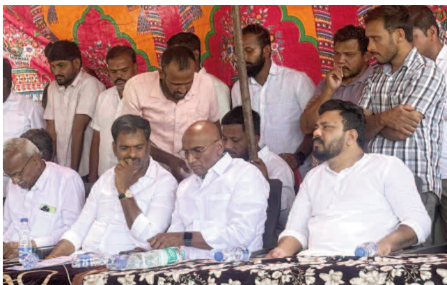
అధికారాన్ని అడ్డం పెట్టుకొని బీఆర్ఎస్ పార్టీ నాయకులు, కార్యకర్తల పైన దాడులు చేస్తే ఊరుకునేది లేదు