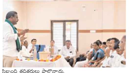
సిబ్బంది తదితరులు పాల్గొన్నారు.