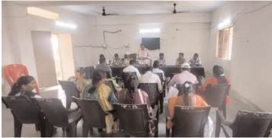
ప్రజలు సకాలంలో హాజరై తమ సమస్యలను అధికారులకు తెలియజేసి ఆ సమస్యలను పరిష్కరించుకోవాలని సూచించారు.

ఆళ్లపల్లి, ఏప్రిల్ 1 (మనం న్యూస్) : నేటి నుండి ప్రజాపాలన- ప్రగతి ప్రణాళిక గ్రామసభలను మండల పరిధిలోని 12 గ్రామ పంచాయతీలలో నిర్వహించనున్నట్లు ఎంపీడీవో డి శ్రీను ఓ ప్రకటనలో తెలిపారు. ఉదయం 9 గంటల నుండి 11 గంటల వరకు ఆయా గ్రామ పంచాయతీ కార్యాలయాలలో పంచాయతీ కార్యదర్శుల అధ్యక్షతన జరిగే గ్రామసభలకు ఇంచార్జ్ అధికారులు పాల్గొని విద్య, రెవెన్యూ, హౌసింగ్, గ్రామీణ తాగునీటి సరఫరా, స్త్రీ శిశు సంక్షేమం, వ్యవసాయం, విద్యుత్ సమస్యలపై చర్చించడం జరుగుతుందని అన్నారు. ఈ గ్రామసభలకు ఆయా గ్రామాల