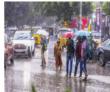
వానోచ్చింది.. ఎండ చల్లబడింది..