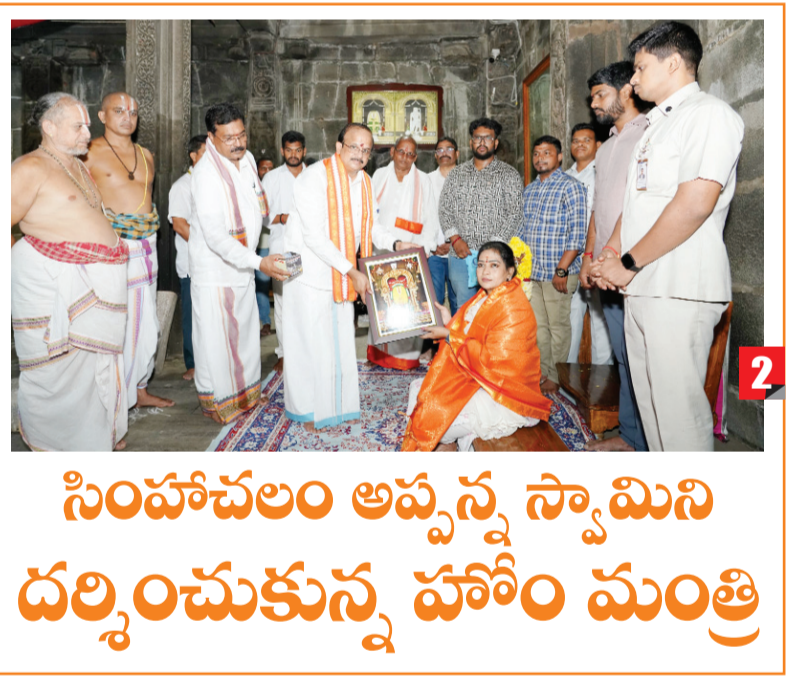
సింహాచలం అప్పన్న స్వామిని దర్శించుకున్న హోం మంత్రి

50% పెంపుతో డీలిమిటేషన్ వల్ల ఎవరికి నష్టం లేదు మంత్రి నిమ్మల రామానాయుడు