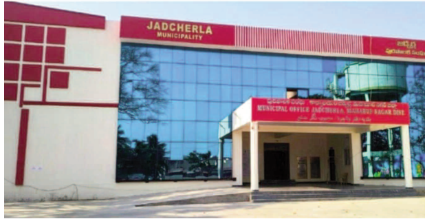
మొత్తం 48 అంశాలు చర్చకు తీసుకొచ్చినట్లు సమాచారం. అలాగే చైర్మన్, వైస్ చైర్మన్, కౌన్సిల్ సభ్యులకు హనరరీయం మరియు అలవెన్సుల పెంపు ప్రతిపాదనలు కూడా సమావేశ అజెండాలో ఉండటం రాజకీయంగా మరింత దుమారం రేపుతోంది. చైర్మన్లు

ఇదే సమావేశంలో మున్సిపల్ కార్యాలయ విభాగానికి సంబంధించిన ఇంటర్నెట్ సేవలు 2026-27 ఆర్థిక సంవత్సరానికి 20,000 ఖర్చుతో రెన్యూవల్, అప్డేటింగ్ సిబ్బంది వేతనాలు, జనరల్ ఫండ్ ఖర్చులు, చైర్మన్ మరియు కమిషనర్ ఆఫీస్ పనుల కోసం తిరుగు ఖర్చులు సహా