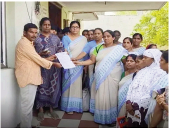
నందిగమ, ఏప్రిల్ 23,(మనం న్యూస్): అంగన్వాడీల సమస్యలను పరిష్కరించడంలో