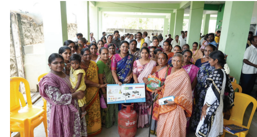
ఎమ్మెల్యే తంగిరాల సౌమ్య

నందిగామ, ఏప్రిల్ 23, (మనం న్యూస్): నందిగామ మండలం ఐతవరం సొసైటీ నందు గురువారం నాడు ప్రధానమంత్రి ఉజ్వల పథకం