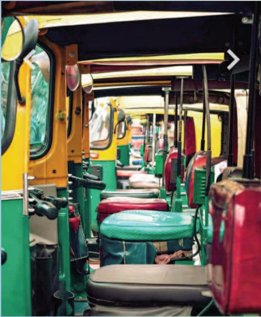
ఆర్టీసీ సమ్మెను క్యాచ్ చేసుకుంటున్న ప్రైవేట్ వాహనాలు లబోదిబోమంటున్న ప్రయాణికులు

మేడ్చల్, ఏప్రిల్ 23 ( మనం జిల్లా ప్రతినిధి ):