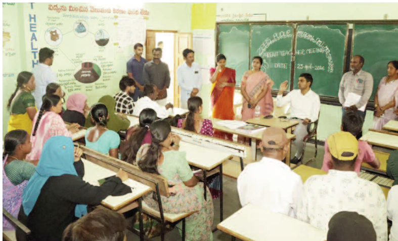
పూడూరు జెడ్పీ హైస్కూల్ను ఆకస్మిక తనిఖీ చేసిన జిల్లా కలెక్టర్