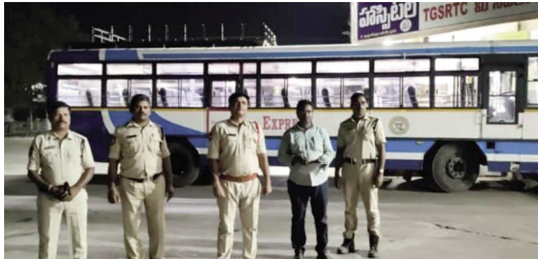
- పోలీసు భద్రత నడుమ ప్రైవేటు బస్సులు పునరుద్ధరణ - ఆర్టీసీ కార్మికుల పరిష్కారించాలి అని డిమాండ్