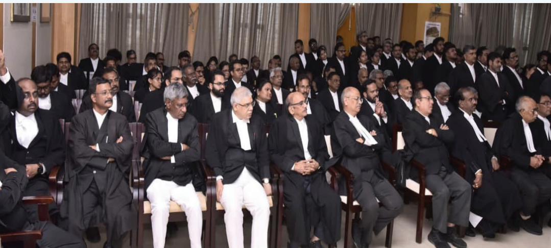
అవగాహన పెంపుకు కృషి చేశారన్నారు.