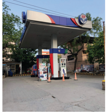
బంకులు తిరిగినా ఎక్కడా దొరకడం లేదు.

తాడేపల్లి, ఏప్రిల్ 24, మనం న్యూస్: తాడేపల్లి మండలం మరియు దాని పరిసర ప్రాంతాల్లో గత కొద్ది రోజులుగా పెట్రోల్, డీజిల్ కొరత వాహనదారులను తీవ్ర ఇబ్బందులకు గురిచేస్తోంది. ముఖ్యంగా ఉండవల్లి సెంటర్ వంటి కీలక ప్రాంతాల్లోని పెట్రోల్ బంకుల్లో 'నో డీజిల్' బోర్డులు దర్శనమిస్తుండటంతో ప్రయాణికులు, రైతులు బెంబేలెత్తిపోతున్నారు. బంకుల్లో నిల్వలు నిండుకోవడంతో ఉన్న కొద్దిపాటి స్టాక్కు కూడా సిబ్బంది రేషన్ పద్ధతిలో విక్రయిస్తున్నారు. కొన్ని చోట్ల వాహనదారులకు 1000 రూపాయలకు మించి డీజిల్ పోసేది లేదని బంకు సిబ్బంది తెగేసి చెబుతున్నారు.