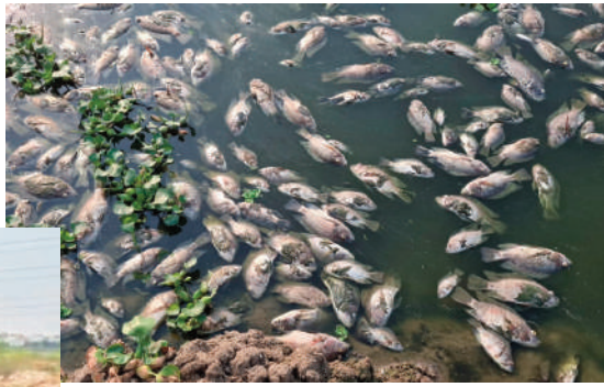
కారణమయ్యాయని తెలిపారు. ఈ సమస్యపై కాలుష్య నియంత్రణ శాఖ, స్థానిక మున్సిపల్ అధికారులు వెంటనే స్పందించి చెరువులోకి మురుగు నీరు చేరకుండా చర్యలు తీసుకోవాలని మత్స్యకారులు డిమాండ్ చేస్తున్నారు.

మేడ్చల్, ఏప్రిల్ 26 (మనం జిల్లా ప్రతినిధి) : చేపల మరణంతో చేపల ఉత్పత్తి తగ్గిపోవడంతో పాటు వేటకు వెళ్లే మత్స్యకారులకు ఆదాయం లేకుండా పోతోందని లక్షల్లో నష్టం వాటిల్లుతున్నాయని ఆందోళన చెందుతున్నారు. సంబంధిత అధికారులకు ఎన్నిసార్లు ఫిర్యాదులు చేసిన స్పందించడం లేదని బాధితులు ఆరోపిస్తున్నారు. స్థానికులు చెబుతున్న వివరాల ప్రకారం, విల్డస్ నుంచి వచ్చే డ్రైనేజీ నీరు నేరుగా చెరువులో కలుస్తుండటంతో నీరు నల్లగా మారి దుర్వాసన వల్ల చెరువులో చేపల మృతికి