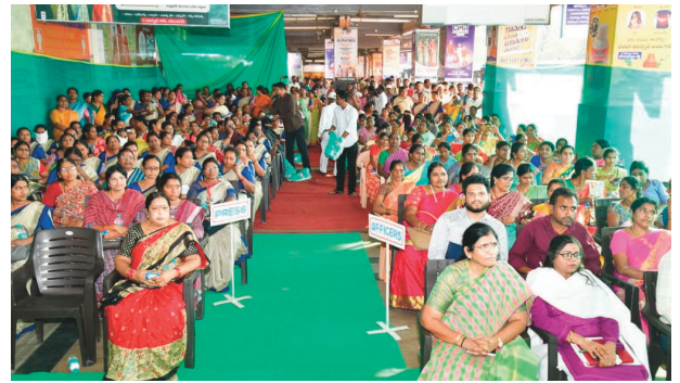
డబ్బు ఆదా అవుతోంది

మహాలక్ష్మి పథకం మంచి పథకం. ఆపత్కాలంలో మహిళలకు అండగా నిలుస్తున్నది. అత్యవసరంగా బయటకు వెళ్లేందుకు మహిళలు ఆర్టీసీలో ఉచితంగా ప్రయాణిస్తున్నారు. చిరుద్యోగులకు ఎంతో ప్రయోజనకరంగా మారింది. జీతాలు తక్కువ ఉండడం వల్ల బస్సుల్లో ప్రయాణించడం వల్ల కొంత డబ్బులను ఆదా చేసుకుంటున్నాం. మహిళల్లో ఎంతో మార్పు వచ్చింది. సమావేశాలకు ఇతర కార్యక్రమాలకు వెళ్లేందుకు ఆర్టీసీ బస్సులను ఉపయోగించుకుంటున్నాం. ఎంతో లాభం చేకూరుతున్నది. ప్రభుత్వం మంచి ఆలోచనతో ఈ పథకాన్ని ప్రవేశపెట్టింది.