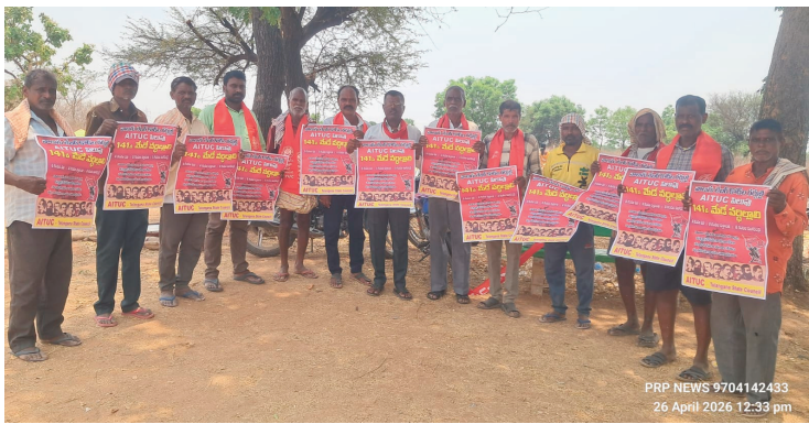
PRP NEWS 9704142433 26 April 2026 12:33 pm