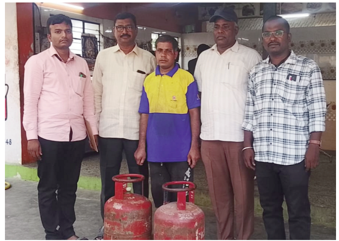
మొత్తానికి అమ్మి సొమ్ము చేసుకున్నట్లు తమ దృష్టికి వచ్చిందని అందువల్లనే దుకాణాలను తనిఖీ చేస్తున్నట్లు