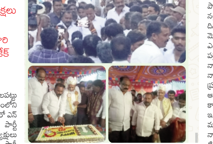
బెంగళూరు చెన్నై తాతగారు మీదగా కేక్ కట్టడం చిరునవ్వులను గుండె కట్టింది. బెంగళూరు తెలుగుదేశం