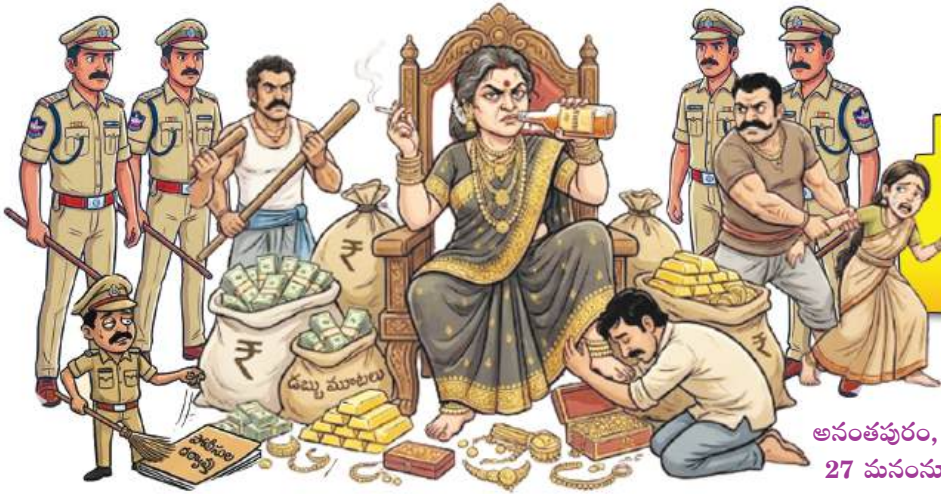
అనంతపురం, ఏప్రిల్ 27 మనం న్యూస్ :

మంగళవారం - 28 - ఏప్రిల్ - 2026 : పేజీలు 12