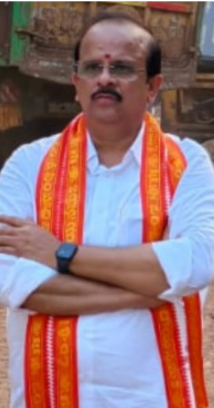
ఆస్థాన మండపము వరకు అన్ని ప్రాకారాలను ప్రత్యేకము గా సంప్రదాయబద్ధంగా శుద్ధి చేస్తారు. ఆలయ పరిసరాలను దైవిక శక్తితో పునీతం చేసే ఈ పవిత్ర కార్యక్రమ నిర్వహణ కారణంగా మంగళవారం నాటి దర్శన సమయాల్లో కొన్ని మార్పులు చేసినట్లు తెలిపారు. మధ్యాహ్నం 2:00 గంటల నుండి రాత్రి 9:00 గంటల వరకు స్వామివారి సర్వదర్శనాలు నిలుపుదల చేయబడును. తిరిగి మరుచుట రోజు యధావిధిగా స్వామివారి దర్శనం లభించును. కావున దూరప్రాంతాల నుండి విచ్చేసే భక్తులు, స్థానిక భక్తులు ఈ సమయం మార్పును గమనించి, దేవస్థాన సిబ్బందికి సహకరించవలసిందిగా కార్యనిర్వహణ అధికారి కోరారు.

సింహాచలం , ఏప్రిల్ 12 ( మనం న్యూస్ ) : శ్రీ వరాహ లక్ష్మీనరసింహస్వామి దివ్య క్షేత్రమైన సింహాచలంలో అత్యంత పవిత్రమైన "కోయిల్ ఆక్వార్ తిరుమంజనం సేవ", కారణముగా ఈ నెల 2026 ఏప్రిల్ 14 (మంగళవారం) స్వామివారి దర్శన వేళల్లో కొన్ని మార్పులు చేసినట్లు ఆలయ నిర్వహకుల తెలిపారు. ఆధ్యాత్మిక సంప్రదాయం ప్రకారం, ఆలయ శుద్ధి కార్యక్రమాన్ని 'కోయిల్ ఆక్వార్ తిరుమంజనం' అంటారు. ఈ పవిత్ర కార్యక్రమంలో భాగంగా గర్భాలయం మొదలుకుని