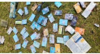
పోలవరం జిల్లా, చింతూరు, ఫిబ్రవరి 14 (మనం న్యూస్): పోలవరం జిల్లా చింతూరు మండలం

ఏడుగురాళ్ల వల్లి గ్రామంలో అనుమానాస్పద ఘటన చోటుచేసుకుంది. గ్రామానికి చెందిన పెద్ద చెరువులో వందల సంఖ్యలో ఏటీఎం కార్డులు, పాస్ కార్డులు బయటపడటంతో స్థానికంగా తీవ్ర భయాందోళనకు గురయ్యారు వివరాల్లోకి వెళ్తే.. గ్రామస్తులు ఈరోజు ఉదయం చాపల వేటకు చెరువుకు వెళ్లారు. సాధారణంగా వల విసిరి చేపలు పట్టే క్రమంలో, ఈసారి చేపల బదులుగా వందల సంఖ్యలో ఏటీఎం కార్డులు, పాస్ కార్డులు వలలో చిక్కుకోవడంతో ఒక్కసారిగా వారు ఆశ్చర్యానికి గురయ్యారు. ఈ విషయం గ్రామంలో నోటిమాటగా వ్యాపించి పెద్ద ఎత్తున జనాలు చెరువు వద్దకు చేరుకున్నారు. సమాచారం అందుకున్న చింతూరు పోలీసులు సంఘటనా స్థలానికి చేరుకుని వివరాలు సేకరిస్తున్నారు. ఈ విషయంపై మనం పత్రిక రిపోర్టర్ వివరాలు అడగగా ఎస్ఐ సంతోష్ కుమార్ స్పందిస్తూ, “ఇంత పెద్ద మొత్తంలో కార్డులు చెరువులో ఎలా పడిపోయాయనే దానిపై అన్ని కోణాల్లో దర్యాప్తు చేస్తున్నాం. అసాంఘిక కార్యకలాపాలకు సంబంధించినదా, లేక మరే ఇతర కారణమా అన్నది విచారణలో తేలుతుంది” అని తెలిపారు. దట్టమైన అడవి ప్రాంతంలో ఉన్న ఈ చెరువులో ఇంత పెద్ద సంఖ్యలో కార్డులు లభించడం పలు అనుమానాలకు తావిస్తోంది. కొందరు ఇది అక్రమ కార్యకలాపాలకు సంబంధించి ఉండవచ్చని, మరికొందరు ఇతర ప్రాంతాల నుంచి తెచ్చి పడిసి ఉండవచ్చని అనుమానాలు వ్యక్తం చేస్తున్నారు. ప్రస్తుతం పోలీసులు కార్డుల వివరాలు సేకరించి, వాటి యజమానులను గుర్తించే పనిలో నిమగ్నమయ్యారు. పూర్తి వివరాలు దర్యాప్తు అనంతరం వెలుగులోకి రానున్నాయి.