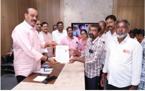
నిమ్మాడ, ఏప్రిల్ 16 ( మనం న్యూస్ ) : రాష్ట్రంలో ప్రతి పేద కుటుంబానికి సొంతిల్లు కల్పించడం కూటమి ప్రభుత్వ ప్రధాన సంకల్పమని, ఇళ్ల పట్టాల పంపిణీ వేగవంతం చేయాలని, 2029 నాటికి ఈ లక్ష్యాన్ని సాధించేందుకు కట్టుబడి ఉన్నామని రాష్ట్ర

వ్యవసాయ శాఖ మంత్రి కింజరాపు అచ్చెన్నాయుడు ప్రకటించారు. నిమ్మాడలోని తన క్యాంప్ కార్యాలయంలో రెవెన్యూ శాఖ అధికారులతో సమీక్ష సమావేశాన్ని నిర్వహించారు, ప్రభుత్వ లక్ష్యానికి అనుగుణంగా అధికారులు పనిచేయాలని పూచించారు, కోటబోమ్మాళ్లి మండలం భవనిపురం గ్రామానికి చెందిన పేద లబ్ధిదారులకు ఆయన చేతుల మీదుగా ఇళ్ల పట్టాలు పంపిణీ చేశారు. ఈ సందర్భంగా మంత్రి మాట్లాడుతూ, పేదల జీవితాల్లో స్థిరత్వం తీసుకురావడంలో గృహ నిర్మాణం కీలకమని పేర్కొన్నారు. ప్రతి పేదవాడికి సొంతిల్లు ఉండాలనే లక్ష్యంతో ప్రభుత్వం ప్రణాళికాబద్ధంగా ముందుకు సాగుతోందని తెలిపారు. గత ప్రభుత్వంపై తీవ్రంగా స్పందించిన మంత్రి, పేదల సొంతింటి కలను గత పాలకులు ఛిద్రము చేశారని విమర్శించారు. లబ్ధిదారులకు చెల్లించాల్సిన సుమారు రూ.900 కోట్ల బకాయిలను పెండింగ్లో ఉంచడం ద్వారా గృహ నిర్మాణ రంగాన్ని పూర్తిగా దెబ్బతీశారని ఆరోపించారు. ఆ బకాయిలన్నింటినీ చెల్లించే బాధ్యతను కూటమి ప్రభుత్వం స్వీకరించిందని స్పష్టం చేశారు. అలాగే, నివాసయోగ్యం కాని ప్రాంతాల్లో పేదలకు ఇళ్ల స్థలాలు కేటాయించడం వల్ల వారు తీవ్ర ఇబ్బందులు ఎదుర్కొన్నారని మంత్రి పేర్కొన్నారు. ఇకపై అలాంటి పరిస్థితులు రాకుండా సమగ్ర ప్రణాళికతో గృహ నిర్మాణ కార్యక్రమాలను అమలు చేస్తున్నామని తెలిపారు. “ఇది పేదల ప్రభుత్వం” అని స్పష్టం చేసిన మంత్రి, పేదలకు న్యాయం చేయడం, వారి జీవన ప్రమాణాలను మెరుగుపరచడం ప్రభుత్వ ముఖ్య బాధ్యతగా భావిస్తున్నామని అన్నారు. ప్రతి అర్హుడైన లబ్ధిదారుడికి పారదర్శకంగా, వేగవంతంగా ఇళ్లను అందించడంలో ఎలాంటి రాజీ ఉండదని తెలిపారు. సమావేశంలో టెక్నాలజీ ఆర్డీవో కృష్ణమూర్తి, నాలుగు మండలాల రెవెన్యూ అధికారులు పాల్గొన్నారు.