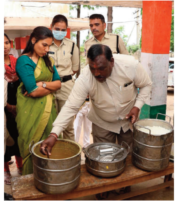
నాణ్యమైన విద్య, పాఠశాలలో అందించడంపై

ప్రజాపాలన -పుగతి ప్రణాళిక 99 రోజుల కార్యచరణలో భాగంగా ఏప్రిల్ 2 నుండి రాష్ట్రవ్యాప్తంగా గ్రామసభలు మరియు వార్డు సభలను పకడ్బందీగా, పెద్ద ఎత్తున నిర్వహించాలని రాష్ట్ర ఉప ముఖ్యమంత్రి మల్లు భట్టి విక్రమార్క సూచించారు. మంగళవారం హైదరాబాద్ నుండి ప్రభుత్వ ప్రధాన కార్యదర్శి రామకృష్ణారావు, వివిధ శాఖల కార్యదర్శులతో కలిసి వీడియో కాన్ఫరెన్స్ ద్వారా జిల్లా కలెక్టర్లు, అదనపు కలెక్టర్లు మరియు జిల్లా స్థాయి అధికారులతో సమీక్ష సమావేశం నిర్వహించారు.