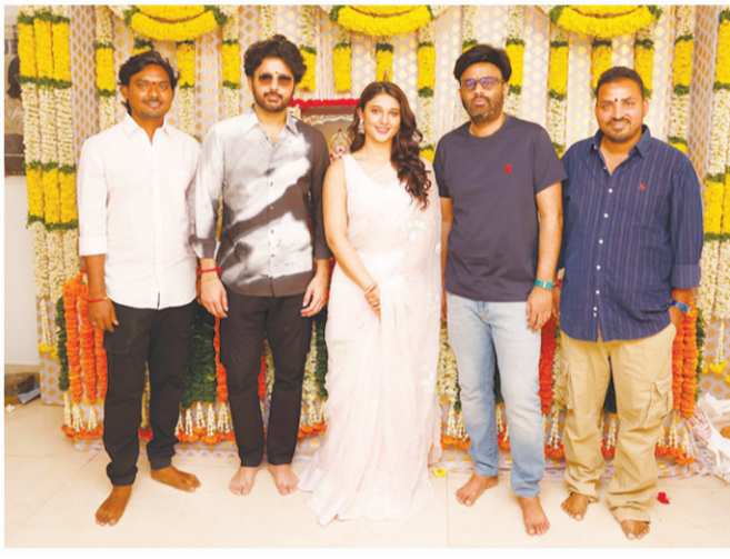
నువేటి పట్టాకెక్కిన సున్నట్టు కూడా ఖరారు చేశారు. మరి ఇంత తేలిపోయింది. ఇక ఈ చిత్రాన్ని మేకర్స్ ఈ మే రెండో వారం

మన టాలీవుడ్ యూత్ స్టార్ నితిన హీరోగా సాలిడ్ హిట్ కొట్టాలని చూస్తున్నాడు. తన గత చిత్రం తమ్ముడు డిజిటాయింట్ చేయడంతో నెక్స్ట్ సినిమాలో కోసం అభిమానులు ఎదురు చూడడం మధ్యలో నితిన పలు సినిమాల వదిలేయడం కూడా జరిగిపోయాయి. అయితే ఫైనల్ గా నితిన నుంచి ఈ ఏడాదిలో రెండో కొత్త సినిమా ఇప్పుడు అధికారికంగా ముహూర్త కార్యక్రమాలతో లాంఛ్ అయ్యింది. నాగవంశీ, సాయి సౌజన్య నిర్మాతలుగా సోమశేఖర్, నారి సిరివెళ్ల అనే కొత్త దర్శకులతో నేడు మేకప్ వుచూర్య కార్యక్రమాలతో సినిమాని లాంఛ్ చేసిన ఫోటోలు ఇప్పుడు వెరల్ గా మారాయి. అంతే కాకుండా యంగ్ హీరోయిన్ రితికా నాయక్ కూడా ఇందులో పాల్గొనడంతో హీరోయిన్ ఎవరు అనేది కూడా తెలియింది. ఇక ఈ చిత్రాన్ని మేకర్స్ ఈ మే రెండో వారం