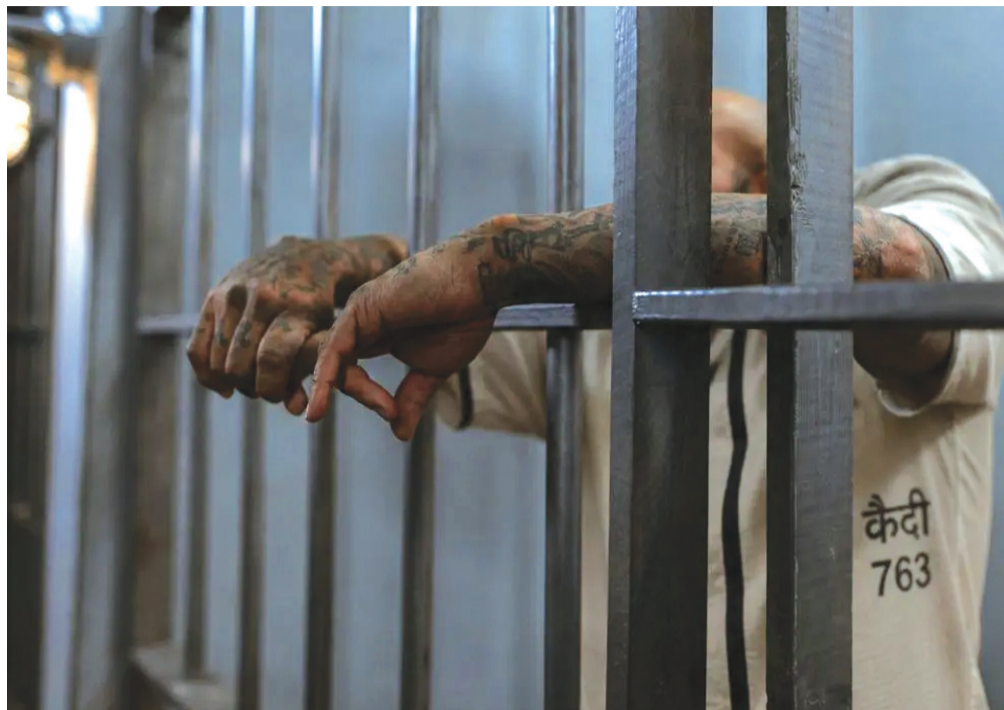
ఫీల్ ది జైల్ కోర్టు కార్యక్రమం ... ఖైదీల జీవనశైలి, వారు ఎదుర్కొనే పరిస్థితులు, స్వేచ్ఛ వీలు గురించి ప్రజలకు, ముఖ్యంగా యువతకు అవగాహన కల్పించడమే ముఖ్య ఉద్దేశం అంటున్నారు. ఈ కార్యక్రమంలో భాగంగా 24 గంటల పాటు జైలులో గడపాలనుకునే వారు రూ. 2,000 చెల్లించాల్సి ఉంటుంది. 12 గంటల అనుభవం కోసం రూ. 1,000 ఫీజుగా నిర్ణయించారు. ఇందులో పాల్గొన్న వారికి ప్రత్యేకంగా రూపొందించిన జైలు గడులలో బస్ కల్పిస్తారు. ఖైదీలకు ఇచ్చే భోజనం అందించి, జైలు నిబంధనలు, ఖైదీల దినచర్యను పాటించజేస్తారు. అంటే మీరు ఒక రోజు ఖైదీ అవుతారన్నమాట.