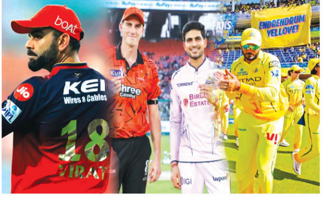
మేమున్నామంటూ హెచ్చరించాయి. దిల్లీ క్యాపిటల్స్ (10), కోల్ కతా నైట్ రైడర్స్ (9) సాంకేతికంగా మాత్రమే బరిలో ఉన్నాయి. ముంబయి, లాక్ నపూ ఎప్పుడో దుకాణం సర్దుకొంటాయి.

వైదీ జట్టు తలపడతూన్న జపీఎల్ పందొమ్మిదో విడిపోవడం తర్వాత మిగిలిన ముగింపు దశకు చేరుకుంటున్నాయి. ఇప్పటికే 57 మ్యాచులు అయిపోయాయి. ఇక మిగిలినవి కేవలం 13 లీగ్ మ్యాచులే. ఇవే ఫైనల్స్ లో ఉండి టాప్-4 జట్లను డిస్టెండ్ చేసేవి. నాకాట్ కు చేరుకుంటామని కోనేటి తీవ్ర లక్ష్యం. రాయల్ ఛాలెంజర్స్ బెంగళూరు (16), గుజరాత్ టైటాన్స్ (16), సన్ రైజర్స్ హైదరాబాద్ (14), పంజాబ్ కింగ్స్ (13) తొలి నాలుగు స్థానాల్లో కొనసాగుతున్నాయి. చెన్నై సూపర్ కింగ్స్ (12), రాజస్థాన్ రాయల్స్ (12) కూడా ఫైనల్స్ రేసులో