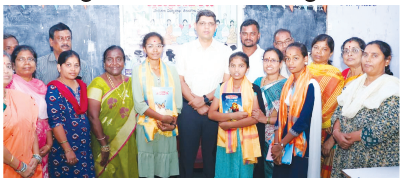
క్రమశిక్షణతో చదివి ఉన్నత లక్ష్యాలు సాధించాలి