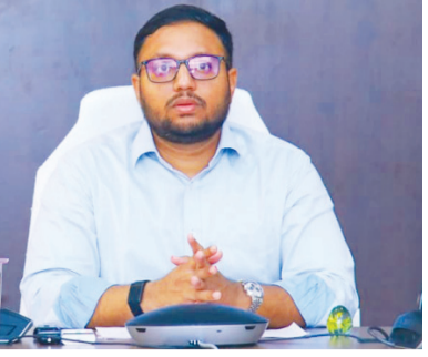
అన్ లోడింగ్ ప్రక్రియ జరిగేలా చూడాలి. అదే విధంగా మిల్లుకు చేరుకున్న లారీలు 12 గంటల లోపు అన్ లోడింగ్ పూర్తి చేయాలని, ఒకవేళ 12 గంటల లోపు అన్ లోడింగ్ ప్రారంభం కాకపోతే, వెంటనే ఆ లారీలను ప్రత్యామ్నాయ అన్ లోడింగ్ పాయింట్లకు మళ్లించాలని సూచించారు. కొనుగోలు కేంద్రం నుండి లారీలో ధాన్యం లోడింగ్ పూర్తి చేసి, 3 గంటల లోపు మిల్లుకు తరలించాలన్నారు. ఏ మిల్లుకు ఎన్ని వాహనాలు

వేల నుండి 10 వేల మెట్రిక్ టన్నుల ధాన్యం సేకరించినట్లు తెలిపిన ఆయన.. జిల్లా అసెంబ్లీలో ధాన్యం సేకరణపై తేజస్ నంద్ లాల్ పవార్ అధికారులను ఆదేశించారు. ముఖ్యంగా ధాన్యం కొనుగోలు కేంద్రాలకు సమయానికి లారీలు రావడం లేదని, వచ్చిన లారీలను కూడా సెంటర్ ఇంచార్జీ లు కొన్ని నిర్లక్ష్య మిల్లులకు మూతమే ఎక్కువగా పంపిస్తున్నారని అభ్యంతరం వ్యక్తం చేశారు. దీనివల్ల మిల్లుల వద్ద లారీలు గంటల తరబడి నిలిచిపోతున్నాయన్నారు. మండల తహశీల్దార్లు ప్రత్యేక బాధ్యత తీసుకొని, మిల్లుల వద్ద ఎక్కువ లారీలు నిలిచిపోయిన చోట త్వరితగతిన