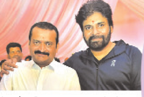
మీడియాలో వైరల్ గా మారింది. మరో ఇలాంటి ఊహించని సినిమా పడలి అంటే అందుకు కాలం కూడా బాగా కలిసి రావాలి..

ప్రపర స్టార్ అలాగే ఏపీ ఉప ముఖ్యమంత్రి పవన్ కళ్యాణ్ కి ఉన్న ప్రాధాన్యతను నిర్ణాత బండ్ల గణేష్ కూడా ఒకరు. తనకి తీసే మరో వంటి వైఫల్యం తర్వాత ఇచ్చిన గబ్బర్ సింగ్ బండ్ల గణేష్ జీవితాన్ని మార్చేసింది. అలాంటి తన హీరోతో మరో సినిమా చెయ్యాలని తాను మాత్రమే కాకుండా అభిమానులు కూడా ఎప్పుడు నుంచో ఎంతో ఆసక్తి ఎదురు చూస్తున్నారు. అయితే పవన్ తో మరో సినిమా విషయంలో నిర్ణాత బండ్ల గణేష్ కొన్ని షాకింగ్ హాట్ కామెంట్స్ చేయడం ఇప్పుడు వైరల్ గా మారింది. తన బ్యానర్ లో పవన్ కళ్యాణ్ ఒక్క సినిమా ప్రపంచ వ్యాప్తంగా ఉన్న తెలుగు ఆడియెన్స్ అంతా ఒక్కసారిగా ఉలిక్కిపడేలాంటిది చేసి అప్పుడు బ్యానర్ ని ఆపాలని కోరుకుంటున్నట్లు లేటెస్ట్ పాడ్ క్యాస్ట్ లో చెప్పడం ఇప్పుడు సోషల్