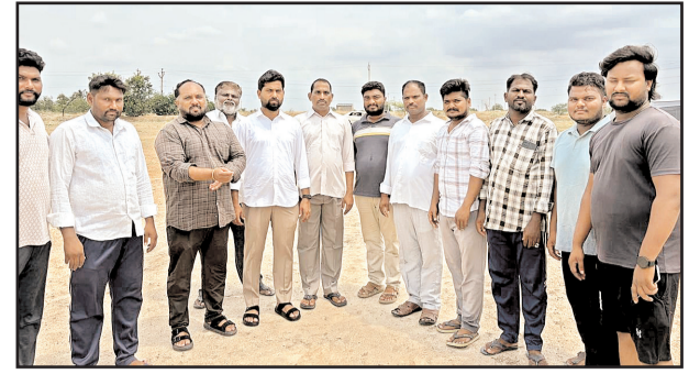
వీరబల్లి మండల ప్రజలు తదితరులు పాలుగొనడం జరిగింది.