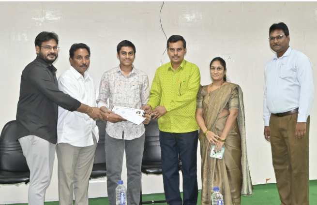
ప్రతిభ చూపిన 22 మంది విద్యార్థులకు 2లక్షల రూపాయల నగదు బహుమతుల అందజేత