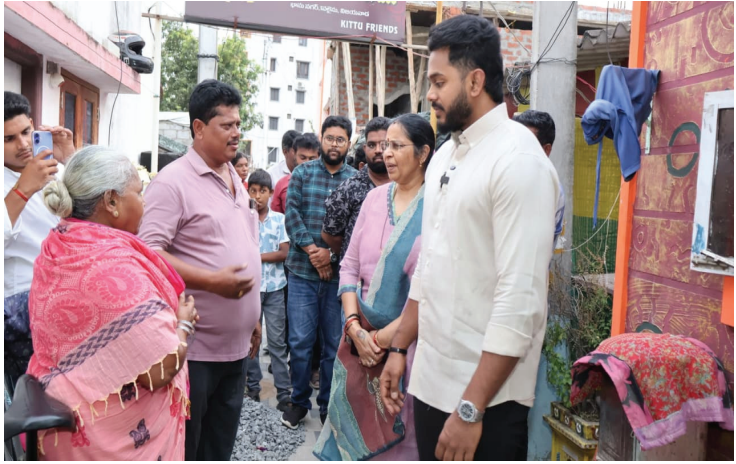
బొండా ఉమా కాలనీ ప్రజలను కలిసి కృతజ్ఞత భావంతో కాలనీవాసులంతా కలిసి తమ ప్రాంతానికి బొండా ఉమా కాలనీ అని నామకరణం చేసి, స్వయంగా ప్రారంభించడం జరిగింది.

ప్రభుత్వం అందిస్తున్న సంక్షేమ పథకాలను వివరించడంతో పాటు, ప్రజల అవసరాలను, సమస్యలను కూడా తెలుసుకున్నారు. ఈ సందర్భంగా కాలనీ ప్రజలు మాట్లాడుతూ గత ప్రభుత్వంలో ఎన్నిసార్లు మొరపెట్టుకున్నా ఎవరూ పట్టించుకోలేదని, కానీ తెలుగుదేశం ప్రభుత్వం ఏర్పడిన తర్వాత ఎమ్మెల్యే బొండా ఉమామహేశ్వరరావు పేదల సమస్యలను తమవిగా భావించి పరిష్కరించారని తెలిపారు. ఆయన కృషి వల్లే నేడు తమ కాలనీ అభివృద్ధి చెంది సుఖశాంతులతో జీవిస్తున్నామని అన్నారు. ఈ కృతజ్ఞత భావంతో కాలనీవాసులంతా కలిసి తమ ప్రాంతానికి బొండా ఉమా కాలనీ అని నామకరణం చేసి, స్వయంగా ప్రారంభించడం జరిగింది. అధికారంలో ఉన్నా లేకపోయినా ప్రజల కోసం నిరంతరం పనిచేసే కుటుంబంగా బొండా కుటుంబం నిలిచిందని, అదే ధోరణిలో బొండా సిద్ధార్థ కూడా ప్రతి డివిజన్లో పర్యటిస్తూ అభివృద్ధి, సంక్షేమంపై దృష్టి సారీస్తున్నారని ప్రజలు అభినందించారు. భవిష్యత్తులో బొండా ఉమామహేశ్వరరావు, బొండా సిద్ధార్థ మరింత ఉన్నత స్థానాలకు చేరుకోవాలని ఆకాంక్షించారు.