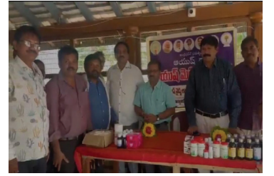
మందులు సద్యనియోగం చేసుకోవాలని ఆర్టీవో అన్నారు.

నందిగామ,మే 4,(మనం న్యూస్): నందిగామ ఆర్టీవో కార్యాలయ ఆవరణలో సోమవారం ఆయుర్వేద వైద్య శిబిరం నిర్వహించారు. ప్రతి సోమవారం నిర్వహించే పీజీఆర్ఎస్ సందర్భంగా ప్రజలకు ఆయుర్వేద సేవలు అందిస్తున్నామని అధికారులు తెలిపారు. ఈ శిబిరంలో ఆయుర్వేద వైద్యులు ప్రజలకు ఉచితంగా వైద్య పరీక్షలు చేశారు. అవసరమైన వారికి మందులు అందజేశారు. ప్రజలు ఉచిత