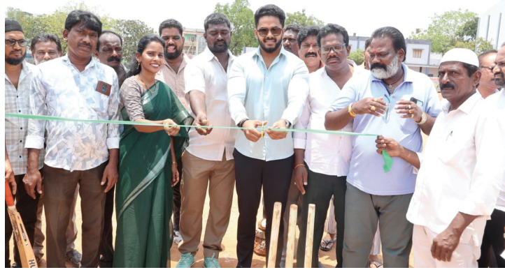
▶▶ టాన్ నిర్వహించి జట్లకు శుభాకాంక్షలు