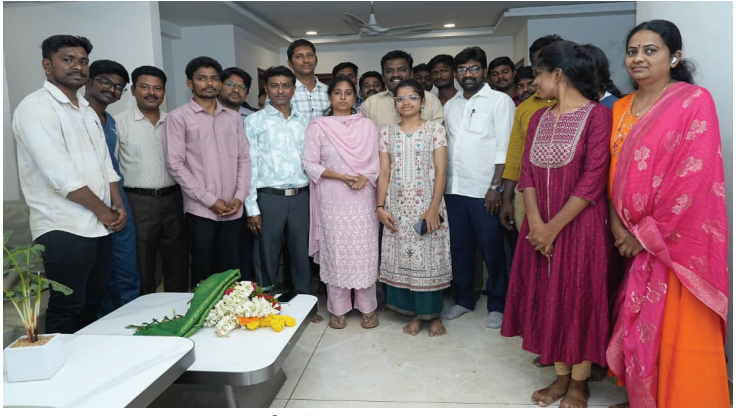
▶▶ ఫిజియోథెరపిస్ట్ ఫెడరేషన్ ప్రతినిధుల మర్యాదపూర్వక భేటీ