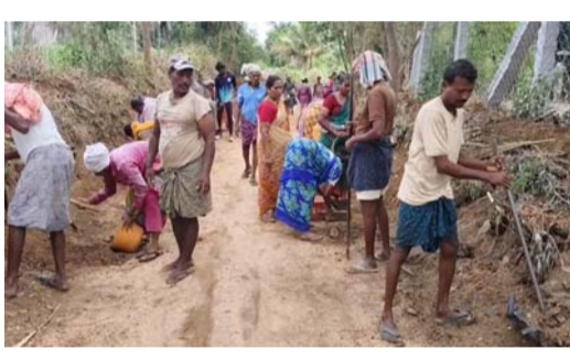
కాలువద్వారా రాయలచెరువుకు వెళ్తుంది. ఈ కాలువ పనులు చేపట్టడం ద్వారా కొత్త వేపకుప్పం పంచాయతీలో పాటు నెత్తకుప్పం, పుల్లమనాయదు కండ్రిగ ప్రాంతాలలోని రైతుల భూములకు సాగు నీరు అందనుంది. తద్వారా ఈ ప్రాంతంలో రైతులు సాగు చేస్తున్న వేరుశనగ, మామిడి చెరుకు, వరి వంటలకు నీరు సమృద్ధిగా చేకూరుతుంది.

నీటి సంరక్షణ పనులతో మండలంలోని 3262 ఎకరాలకు సాగునీటి లభ్యత కొత్తవేపకుప్పంలో రూ.5.87 లక్షలతో బుగ్గలకోన కాలువ పూడికతీత పనులు కొనసాగింపు