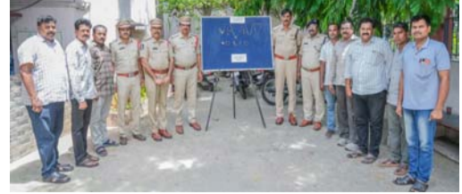
వెళ్లిన సమయాలను గమనించి, తాళాలు వేసి ఉన్న ఇళ్లను లక్ష్యంగా చేసుకుని చోరీలకు పాల్పడినట్లు దర్యాప్తులో వెల్లడైంది. పోలీసులు సాంకేతిక ఆధారాలు, సీసీటీవీ ఫుటేజీలు, అనుమానితుల కదలికలపై ప్రత్యేక నిఘా ఏర్పాటు చేసి నిందితుడిని అదుపులోకి తీసుకున్నారు. విచారణలో నిందితుడు 2024 సంవత్సరంలో తిరుపతి నగర పరిధిలో మొత్తం ఆరు చోరీ కేసులకు పాల్పడినట్లు అంగీకరించారు. నిందితుడి వద్ద నుంచి మొత్తం రూ.18,50,000 నగదు, సుమారు 126.135 గ్రాముల బంగారు ఆభరణాలు స్వాధీనం చేసుకున్నారు. వీటిలో బంగారు గొలుసులు,

రూ.18 లక్షల 50 వేల నగదు, 126 గ్రాముల బంగారు ఆభరణాల స్వాధీనం. ప్రజలు అప్రమత్తంగా ఉండాలని తిరుపతి జిల్లా పోలీసుల విజ్ఞప్తి.