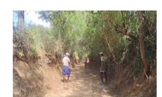
చెరువు పరిధిలో 400 ఎకరాలకు సాగునీరు, 18 బోర్లు, 8 బావుల్లో భాగస్వామిగా పెరుగుతున్న జలాలు పెరుగుతూ మూల్యాంశం రెడ్డి, కొత్తవేపకుప్పం ఉపాధి హామీ వేతనదారుడు బుగ్గలకోన కాలువ పనులు చేస్తున్నామన్నారు. విద్యాసాగర్ భూమి నుండి పురుషోత్తం భూమి వరకు ఈ కాలువ పని కొనసాగి రాయలచెరువులోకి ఈ నీరు చేరుతుందన్నారు. ఈ చెరువు క్రింద 400 ఎకరాల భూములకు సాగు నీరు, 18 బోర్లు, 8 బావుల్లో భాగస్వామిగా పెరిగి వ్యవసాయానికి మేలు కలుగుతుందన్నారు. ఈ పని చేపట్టడం వలన రైతులందరికీ మేలు జరగడంతో పాటు నీటి ఎద్దడి ఏర్పడకుండా ఉంటుందన్నారు. ఈ పథకం ద్వారా తమకు ఉపాధి కల్పించే పనులు కల్పిస్తున్న భారత ప్రధాని నరేంద్ర మోడీ గారికి, రాష్ట్ర ముఖ్యమంత్రి నారా చంద్రబాబు నాయుడు కి, ఉప ముఖ్యమంత్రి పవన్ కళ్యాణ్ కి ధన్యవాదాలు తెలిపారు.

జలధార జలపారిశుధ్య రైతులకు రెట్టింపు ప్రయోజనం. తిరుపతి మే 8 మనం న్యూస్: జలపారిశుధ్యం నేల రైతు వర్షపు చినుకులు పడితే ఎలా జీవం మేల్కొలుపుటాడో ఇప్పుడు జల ధారజల హారతి పనులతో తిరుపతి జిల్లా గ్రామాల్లో అదే దృశ్యం కనిపిస్తోంది. పూడికతీతతో మళ్లీ ఊపిరి పీల్చుకుంటున్న కాలువలు, నిండుపూడికతీత మారే చెరువులు, పెరుగుతున్న భూగర్భ జలాలు రైతు జీవితాల్లో కొత్త ఆశల పుట్టాలని నాయకులన్నారు. ప్రతి నీటి బొట్టును భవిష్యత్తుకు భద్రపరిచే లక్ష్యంతో ప్రభుత్వం చేపట్టిన ఈ పనులు గ్రామీణ ప్రాంతాలకు సాగునీరు, ఉపాధి, ఆనందాన్ని ఒకేసారి అందిస్తున్నాయి. రామచంద్రాపురం మండలంలో జల ధార జల హారతి కార్యక్రమం క్రింద 1 కోటి 20 లక్షల రూపాయల అంచనా వ్యయంతో 48 పనులకు పరిపాలనా ఉత్తర్వులు జారీ చేశారు. ఇందులో 39 డిగ్రీ కాలవల పునరుద్ధరణ, 4 చెక్ డ్యాం లలో పూడికతీత పనులు, 4 కుంభిర కండ్రిగ నిర్మాణం ఒక నీటి కుంటలో పూడికతీత పనులు చేపట్టనున్నారు. ఈ పనులు ద్వారా మండలంలోని 3262 ఎకరాలకు లబ్ధి కలగనుంది. రామచంద్రాపురం మండలంలోని కొత్తవేపకుప్పం గ్రామ పంచాయతీలో 60 మంది ఉపాధి హామీ వేతన దారులతో 1400 మీటర్ల పొడవు, 5.0 మీటర్ల వెడల్పు గల బుగ్గల కోన కాలువ పూడికతీత పనులను రూ. 5,87,519/- అంచనా విలువతో చేపడుతున్నారు. అటవీ ప్రాంతంలో కురిసే వర్షపు నీరు ఈ