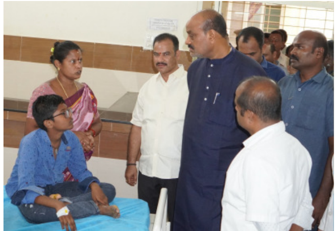
కఠిన చర్యలు ఉంటాయని స్పష్టం చేశారు.