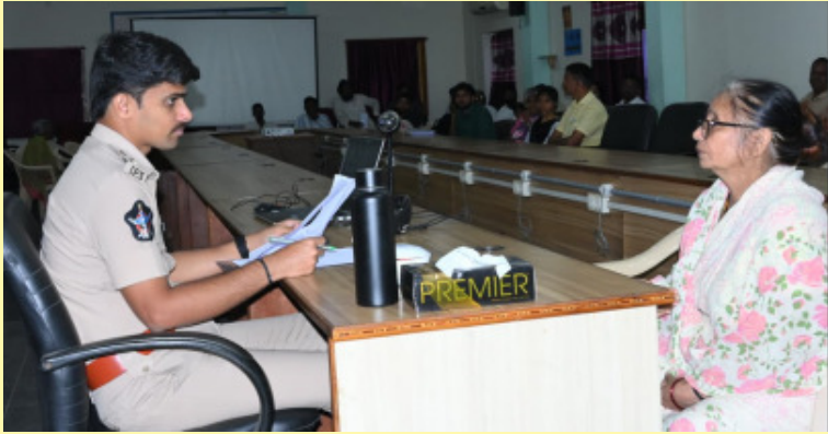
ఆదేశించారు. అర్జీలను జిల్లా ఎస్పీ స్వయంగా పరిశీలించి, ఫిర్యాదుదారులతో మాట్లాడి వారి సమస్యలను అడిగి తెలుసుకున్నారు. అనంతరం సంబంధిత అధికారులతో

శ్రీకాకుళం , మే 11 ( మనం న్యూస్ ) : ప్రజల నుంచి అందిన అర్జీలను త్వరితగతిన పరిష్కరించి, ఫిర్యాదుదారులకు సత్వర న్యాయం అందించాలని జిల్లా ఎస్పీ శ్రీ కె.వి. మహేశ్వర రెడ్డి, ఐపీఎస్ సంబంధిత అధికారులను ఆదేశించారు. సోమవారం జిల్లా పోలీసు కార్యాలయంలో నిర్వహించిన పబ్లిక్ గ్రీవెన్స్ కార్యక్రమంలో జిల్లాలోని వివిధ ప్రాంతాల నుంచి వచ్చిన ప్రజల నుంచి మొత్తం 62 ఫిర్యాదులను జిల్లా ఎస్పీ స్వీకరించారు. ఈ సందర్భంగా ఎస్పీ మాట్లాడుతూ, ప్రజల నుంచి అందిన ప్రతి అర్జీపై సంబంధిత అధికారులు ప్రత్యేక చొరవ తీసుకుని చట్టప్రకారం విచారణ జరిపి త్వరితగతిన పరిష్కార చర్యలు చేపట్టాలని సూచించారు. ఫిర్యాదుల పట్ల ఎట్టి పరిస్థితుల్లోనూ నిర్లక్ష్యం వహించరాదని, బాధితులకు న్యాయం జరిగేలా చర్యలు తీసుకోవాలని