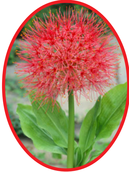
యం పడుతుంది. మొక్క ఒకటిన్నర నుంచి రెండు

చింతపల్లి , మే 11 ( మనం న్యూస్ ) : వేసవి ఎండలు మండిపోతున్న వేళ.. మన్య ప్రాంతాల్లో ప్రకృతి మాత్రం తనదైన శైలిలో రంగుల హరివిల్లును విరబూయిస్తోంది. అడవి ఒడిలో, ఇంటి ముందర, పచ్చని నేలపై ఎర్రటి అగ్నిగోళంలా మెరిసిపోతూ కనిపించే "మే ఫ్లవర్" ప్రస్తుతం మన్యానికి ప్రత్యేక ఆకర్షణగా నిలుస్తోంది. సంవత్సరానికి ఒక్కసారే వికసించే ఈ అరుదైన పుష్పం అందాలు చూసినవారు క్షణం ఆగి తిలకించకుండా ఉండలేని పరిస్థితి నెలకొంది. ఎర్రటి సన్నని రేకులు వందల సంఖ్యలో కలిసి గుండ్రంగా ఏర్పడే ఈ పుష్పం చూడటానికి నిప్పు బంతిలా కనిపిస్తుంది. ప్రకృతి తన చేతులతో జాగ్రత్తగా అల్లిన ఎర్రని పూల కిరీటంలా ఈ పుష్పం మెరిసిపోతుండటంతో గ్రామీణ ప్రాంతాల్లో చిన్నా పెద్దా అందరూ దీన్ని ఆసక్తిగా వీక్షిస్తున్నారు. ముఖ్యంగా ఉదయపు సూర్యకిరణాలు ఈ పుష్పాలపై పడినప్పుడు అవి మరింత కాంతివంతంగా మెరుస్తూ చూపరులను మైమరపింపజేస్తాయి. మే నెలలో మాత్రమే విరబూసే ఈ పుష్పానికి "మే ఫ్లవర్", "మే పుష్పం" అనే పేరు వచ్చింది. శాస్త్రీయంగా దీనిని స్కాడాక్విన్ మల్టీఫ్లోరస్ అని పిలుస్తారు. "ఫుట్ బాల్ లిల్లీ", "బ్లడ్ లిల్లీ" పేర్లతో కూడా ఇది ప్రసిద్ధి చెందింది. లిల్లీ జాతికి చెందిన ఈ దుంప మొక్కను ఒకసారి నాటితే సంవత్సరాల పాటు జీవించి ప్రతి వేసవిలో తన అందాలతో అలరిస్తుంది. మన్యంలో కనిపించే ప్రకృతి వైవిధ్యానికి ఈ మే ఫ్లవర్ ఒక అందమైన గుర్తుగా నిలుస్తోంది. ఎండలు ఎంత తీవ్రంగా ఉంటే ఈ పుష్పాలు అంతగా విరబూయడం విశేషం. ఇసుక నేలల్లో ఇవి బాగా పెరుగుతాయి. దుంపలు పాతబడే కొద్దీ పూల పరిమాణం కూడా పెరుగుతుండటంతో సంవత్సరానికొకసారి మరింత అందంగా వికసిస్తాయి. ఒక పుష్ప పూర్తిగా వికసించేందుకు పది నుంచి పదిహేను రోజుల సమ