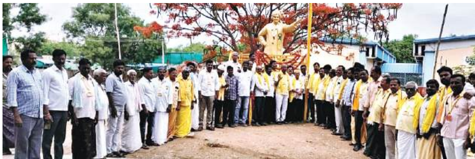
- పార్టీ వ్యవస్థాపకులు నట సార్వభౌమ ఎన్టీఆర్ కు ఘన నివాళులు

లు ఆర్పించారు. తొలి రోజు మహానాడు కు మండలంలోని అమరాపురం, హేమావతి క్లస్టర్ పరిధిలోని టిడిపి నాయకులు, కార్యకర్తలు, పార్టీ అనుబంధ సంఘాల నాయకులు, ప్రజాప్రతి నిధులు, మహిళా నాయకురాలు, కార్యకర్తలు, అభిమానులు అధిక సంఖ్యలో హాజరయ్యారు. పసుపు పండుగా సందర్భంగా పార్టీ ఆధ్వర్యంలో భోజన వసతి కల్పించారు. ఈ కార్యక్రమంలో టిడిపి మండల