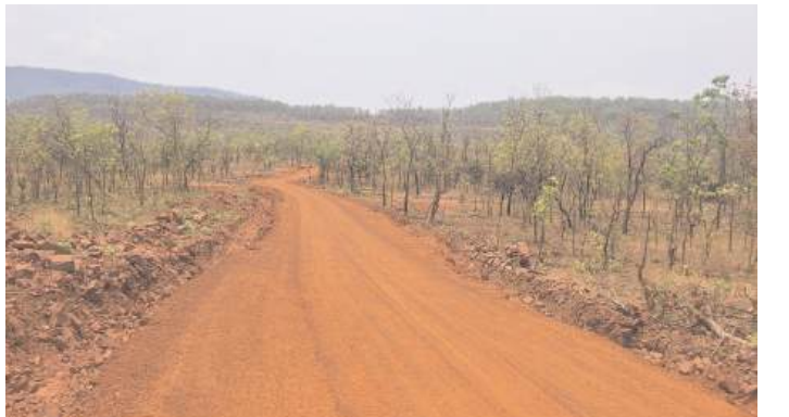
(విగతా రేపటి సంచికలో)