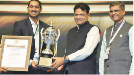
హైదరాబాద్, జూన్ 9 (మనం న్యూస్): భావితరాల ఆకాంక్షలకు అనుగుణంగా తెలంగాణను దేశంలోని ఇతర రాష్ట్రాలకు రోల్ మోడల్ గా తీర్చిదిద్దేలా ప్రణాళికాబద్ధంగా అడుగులు వేస్తున్నామని రాష్ట్ర బీజేపీ, పరిశ్రమల శాఖ మంత్రి శ్రీధర్ బాబు అన్నారు. భవిష్యత్తు ...మిగతా 2లో