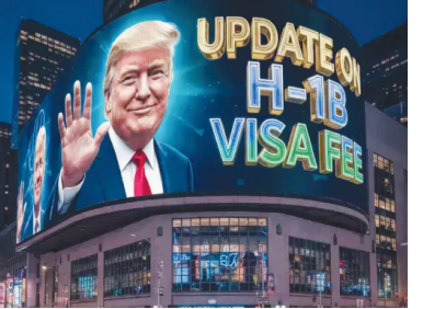
హెచ్-1బీపై లక్ష డాలర్ల ఫీజు కొట్టివేత

వాషింగ్టన్, జూన్ 9: విదేశీ వృత్తి నిపుణుల హెచ్-1బీ వీసాలకు బ్రండ్ సర్కార్ విధించిన లక్ష డాలర్ల ఫీజు చట్టవిరుద్ధమంటూ అమెరికాలోని