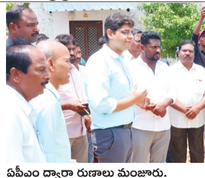
ఏపీఎం ద్వారా రుణాలు మంజూరు.