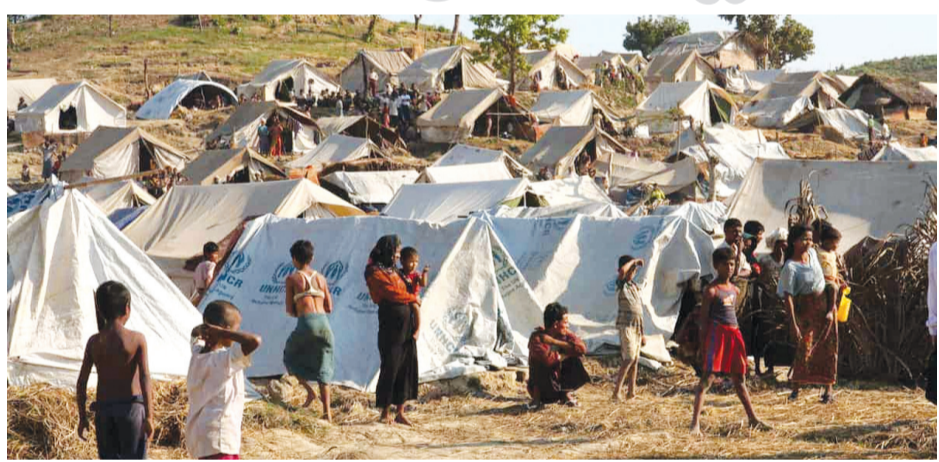
ఉన్నట్లు ఇప్పటికే పోలీసులు గుర్తించారు. రావకొండ కమిషనరీలో పరిధిలో 5 వేల మంది రోహింగాలు, హైదరాబాద్ కమిషనరీలో పరిధిలో 1000, నైజా రాబాద్ కమిషనరీలో పరిధిలో వందలాది మంది రోహింగాలు ఉన్నట్లు పోలీసుల ప్రాథమిక విచారణలో తేలింది. ఇదే విషయాన్ని పోలీసులు కేంద్ర నిఘా ...మిగతా 2లో

రాష్ట్రానికి కేంద్రం ఆదేశాలు హైదరాబాద్ రోహింగాలపై నజర్ దేఖా సేకరణకు పోలీసుల కసరత్తు సహకరిస్తున్న స్థానికులపై ఆరా..!