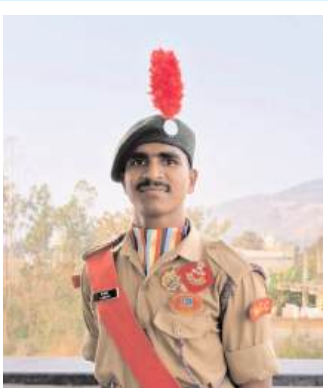
ప్రాంతాలకు చెందిన విద్యార్థులు జాతీయ స్థాయిలో ప్రతిభ కనబరుస్తూ రక్షణ రంగంలో అవకాశాలు దక్కించుకోవడం గర్వకారణమని పేర్కొన్నారు.విద్యార్థుల ఈ