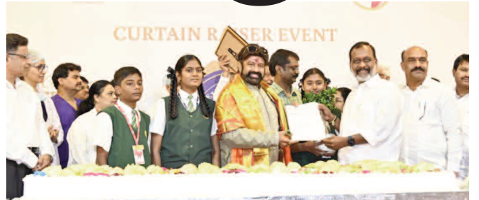
త్రివేణి విద్యార్థుల నగదు వితరణ

సమక్షంలో ఆయన కేక్ కట్ చేసి, వారికి బహుమతులు అందజేశారు. 1989లో తన తండ్రి ఎన్టీఆర్ నాటిను ఈ మొక్క, నేడు 715 పడకలతో దేశంలోనే టాప్ 5 క్యాన్సర్ ఆసుపత్రిలో ఒకటిగా ఎదగడం వెనుక ఎంతోమంది కృషి ఉందని కొనియాడారు.. వారి శ్రమ ఫలితమే ఈరోజు మన భారతదేశంలోనే అగ్రగణ్య ఆసుపత్రి స్థానం సంపాదించుకుంది. అందరికీ నా కృతజ్ఞతలతో పాటుగా అభినందనలు తెలియజేస్తున్నాను'' అని అన్నారు. తన దృష్టిలో వయసు అనేది కేవలం నంబర్ మాత్రమేనన్నారు.