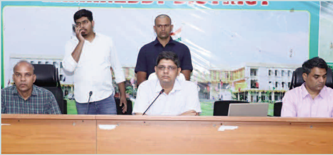
కామారెడ్డి, జూన్ 11 (మనం జిల్లా ప్రతినిధి):