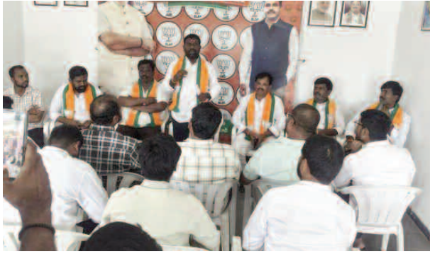
ప్రపంచంలోనే నాల్గవ అతిపెద్ద ఆర్థిక వ్యవస్థగా ఎదిగిందన్నారు. జన్ విశ్వాస్, వికాస్, జన్ కళ్యాణ్ స్ఫూర్తితో దేశ ప్రగతికి కొత్త దిశను నిర్దేశించారని పేర్కొన్నారు. ఈ కార్యక్రమంలో బీఎన్ఎన్ఎల్ బోర్డు మెంబర్