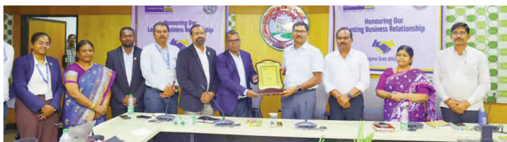
సికింద్రాబాద్, జూన్ 12 (మనం న్యూస్) డీజిల్ పొదుపు పై పెరుగుతున్న డీజిల్ వ్యయభారం నేపథ్యంలో ఇంధన పొదుపు ప్రతి