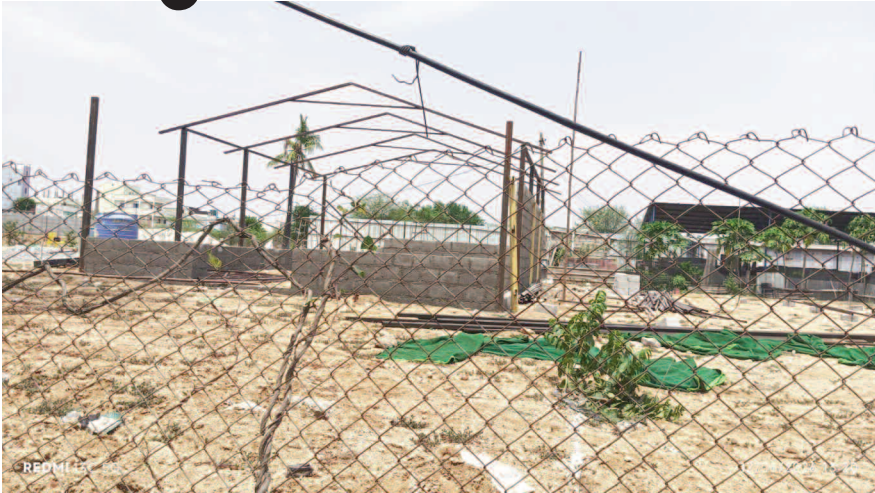
కూడా అధికారులకు లేదని ఆరోపణలు ఉన్నాయి. ఈ నిర్మాణానికి ఎలాంటి అనుమతులు లేవు

మేడ్చల్, జూన్ 12 ( మనం జిల్లా ప్రతినిధి): మేడ్చల్ సర్కిల్ కార్యాలయం పరిధిలో ఉన్నవారికో న్యాయం.. పేదలకు న్యాయం అన్నట్టుగా పాలన సాగుతుంది. రోడ్ల పైన చిన్నచిక్క చాయ్ డబ్బాలు.. షాప్ లో ముందున్న రేకులను తొలగించే జిహాచ్ఎంసి అధికారులు. డబ్బులు ఉన్నవారు కట్టే అక్రమ కట్టడాల వైపు కన్నెత్తి చూడడం లేదన్న విమర్శలు వినిపిస్తున్నాయి. ఈ వ్యత్యాసం మేడ్చల్ సర్కిల్ కార్యాలయం పరిధిలో జోరుగా వినిపిస్తుంది. ముఖ్యంగా గుండ్ల పోచంపల్లి డివిజన్ కార్యాలయంలో ఈ వ్యత్యాసం ఎక్కువగా ఉందని ఆరోపణలు వినిపిస్తున్నాయి. ఇటీవల డివిజన్ కార్యాలయం ముందున్న చాయ్ డబ్బాలను, షాపుల ముందు ఎండ తగలకుండా వేసుకున్న రేకులను బలవంతంగా తొలగించారు. అదే ఉత్సాహం అనుమతులు లేకుండా నిర్మిస్తున్న అక్రమ కట్టడాలపై ఎందుకు చూపడం లేదని ఆరోపణలు ఉన్నాయి. ఇవిగో ఇవి అక్రమ కట్టడాల అంటూ సాక్షాత్ అధికారుల దృష్టికి తీసుకెళ్లిన అధికారులు వారి జోలికి వెళ్లడం లేదని విమర్శలు ఉన్నాయి. దీని వెనుక కారణాలేంటో అధికారులకే తెలవాలి అంటూ స్థానికులు విమర్శిస్తున్నారు. కనీసం వీటికి నోటీసులు ఇచ్చే తీరిక