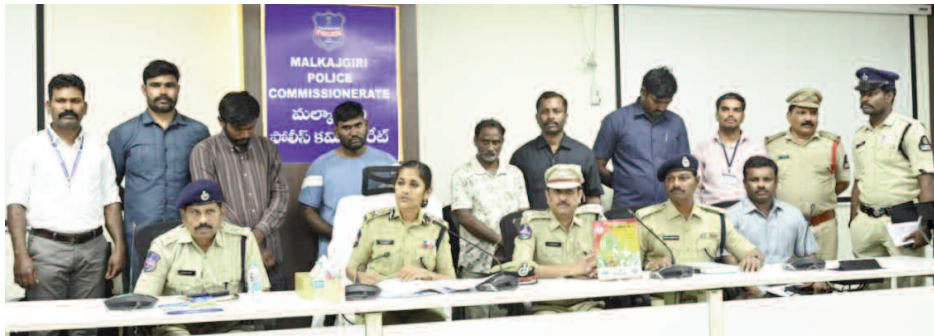
రూ.30 లక్షల విలువైన విత్తనాలు, ప్యాకెట్ల స్వాధీనం..

మేడ్చల్, జూన్ 12 ( మనం జిల్లా ప్రతినిధి ): రైతులను మోసం చేసి అక్రమ లాభాలు ఆర్జించేందుకు నకిలీ పత్తి విత్తనాలను విక్రయించేందుకు సిద్ధమైన ముఠాను మల్కాజిగిరి ఎస్సోటీ టీమ్-2, తిరుమలగిరి పోలీసులు సంయుక్తంగా పట్టుకున్నారు. ఈ ఆపరేషన్లో రూ.30 లక్షల విలువైన 12,800 నకిలీ పత్తి విత్తనాల ప్యాకెట్లు, సుమారు 2,000 కిలోల అనుమానాస్పద నకిలీ విత్తనాలు, ఒక మారుతి ఈకో వాహనం, మూడు మొబైల్ ఫోన్లను స్వాధీనం చేసుకున్నారు. నేరేడ్ మేట్ లోని