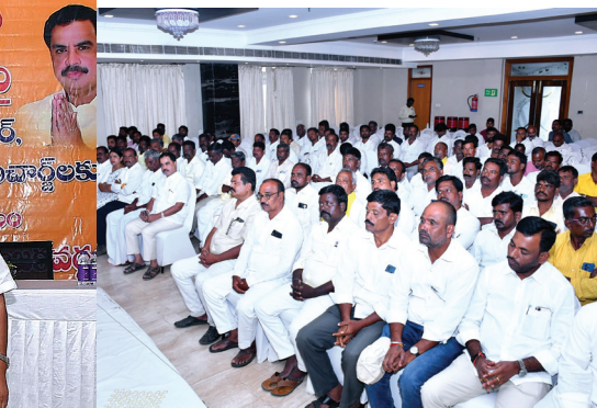
తొలిగించేలా చూడాలని, అంతే కాకుండా పార్టీ బలోపేతం కోసం కొత్త ఓటర్లను చేర్చించేలా చర్యలు తీసుకోవాలన్నారు.

కళ్యాణదుర్గం టౌన్ జూన్ 12 మనం న్యూస్ : క్లస్టర్, కో క్లస్టర్, యూనిట్, బూత్ ఇంచార్జులు, బూత్ లెవెల్ ఏజెంట్ లకు సర్ పై అవగాహన కార్యక్రమం ప్రతి బూత్ లోను ఓటర్ల జాబితా పారదర్శకంగా ఉండే విధంగా పనిచేయాలని ఎమ్మెల్యే అమిలినేని సురేంద్ర బాబు పేర్కొన్నారు నేడు అనంతపురం పట్టణంలోని ఎస్సార్ గ్రాండ్ లో బ్రహ్మాసముద్రం మండలంలోని క్లస్టర్, కో క్లస్టర్, యూనిట్ ఇంచార్జులు, బూత్ ఇంచార్జులు, బూత్ లెవెల్ ఏజెంట్లతో అవగాహన కార్యక్రమాన్ని ఎమ్మెల్యే అమిలినేని సురేంద్ర బాబు నిర్వహించారు.. ప్రస్తుతం జరుగుతున్న సర్ కార్యక్రమంలో బీ ఎల్ ఓ అధికారులతో కలిసి వారి గ్రామాల్లో ప్రతి ఇంటిని సందర్శించి దొంగ ఓట్లను