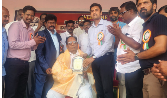
సత్యసాయి జిల్లా అసోసియేషన్ సభ్యులు పాల్గొన్నారు.