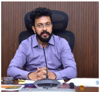
▶ పి.జి.ఆర్.ఎస్ టోల్ ఫ్రీ నంబర్ 1100 ను వినియోగించండి