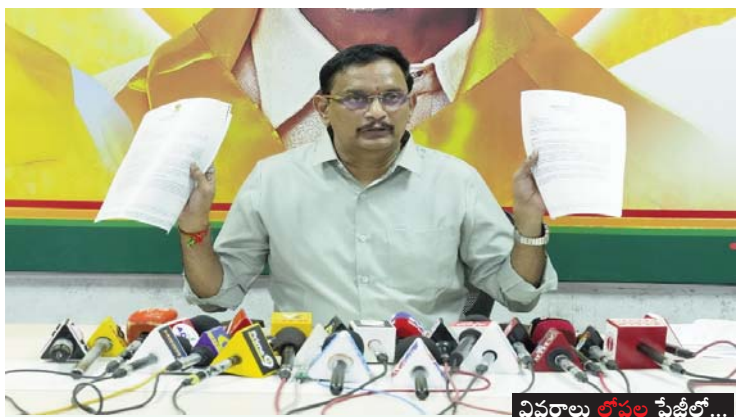
వివరాలు లోపల పేజీలో...