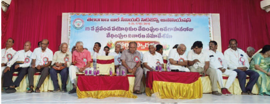
కుటుంబ నియంత్రణ విధానాల కారణంగా