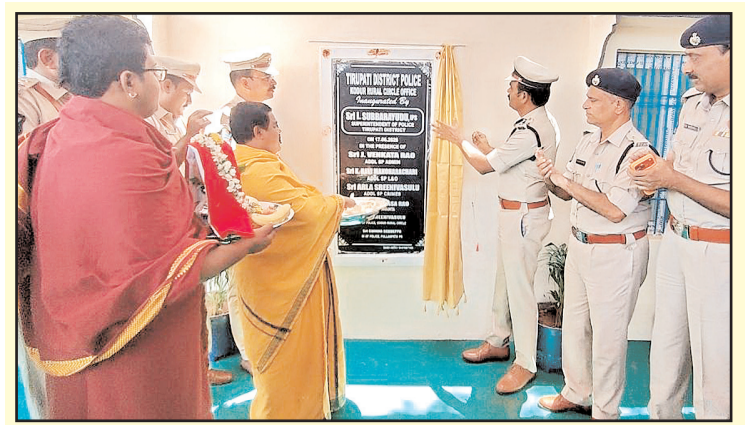
పుల్లంపేటలో నూతన సర్కిల్ పోలీస్