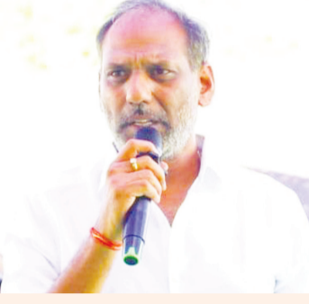
అమరావతి, జూన్ 18, (మనం ప్రత్యేక ప్రతినిధి): పొగాకు రైతులకు గిట్టుబాటు ధర లభించేలా ప్రభుత్వం కట్టుదిట్టమైన చర్యలు చేపడుతోంది...మిగతా 2లో