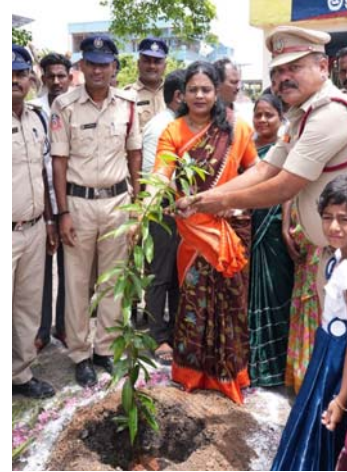
అధికారులు, మున్సిపల్ కమిషనర్ లోవరాజు, కూటమి నాయకులు మరియు ఇతర

తంగిరాల సౌమ్య నందిగామ,జూన్ 20(మనం న్యూస్): నందిగామ పట్టణంలోని ముక్కపాటి కాలనీలో ఉన్న ఆంధ్రప్రదేశ్ రాష్ట్ర విపత్తు స్పందన మరియు అగ్నిమాపక సేవల శాఖ కార్యాలయంలో నూతన ఫైర్ ఇంజన్ను ఆంధ్రప్రదేశ్ ప్రభుత్వ విప్, ఎమ్మెల్యే తంగిరాల సౌమ్య శనివారం ప్రారంభించారు. ఈ కార్యక్రమంలో అగ్నిమాపక కేంద్ర