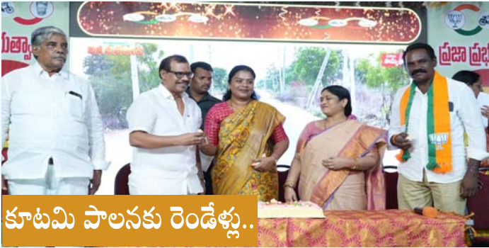
కూటమి పాలనకు రెండేళ్లు..