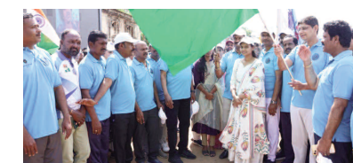
పిలుపునిచ్చారు. జిల్లాలో క్రీడల అభివృద్ధికి ప్రభుత్వం ప్రత్యేక ప్రాధాన్యత ఇస్తోందని, క్రీడాకారులు అందుబాటులో ఉన్న