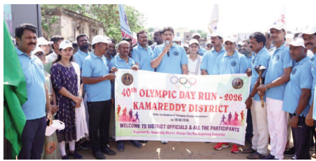
శ్రీకారం చుట్టారు. జడ్పీ ఉన్నత బాలుర పాఠశాల, కామారెడ్డి వద్ద ప్రారంభమైన ఈ రన్ కాకతీయ నగర్లోని సరస్వతి